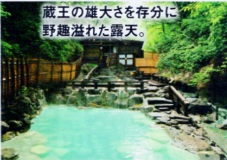
蔵王の雄大さを存分に 野趣溢れた露天。