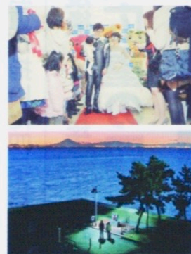
↑近くには、愛を誓い合うためのスポットもある

冬花火が今年も開催! 期間中のほぼ毎週土曜日に、木更津の恋人の聖地「中の島大橋」にて打ち上げ花火が行われる。最終日の2月9日(土)には三井アウトレットパーク木更津にてバレンタインコンサートなど、様々な催し物が盛りだくさん! フィナーレには恋をテーマにした、音楽とシンクロナするミュージック花火が上がる!! 冬の澄み切った夜空に打ち上がり、夏とはまた違う風情が楽しめるロマンティックな時間を過ごしてみたいかが。