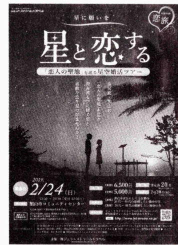
星空婚活ツアーのチラシ

館山市内に3か所あり、恋人の聖地のモニュメントを巡る星空婚活ツアーが24日、同市コミュニティセンターに集合（午後0時半）で開かれ、館山城―館山夕日桟橋―洲崎灯台とバスで巡る。