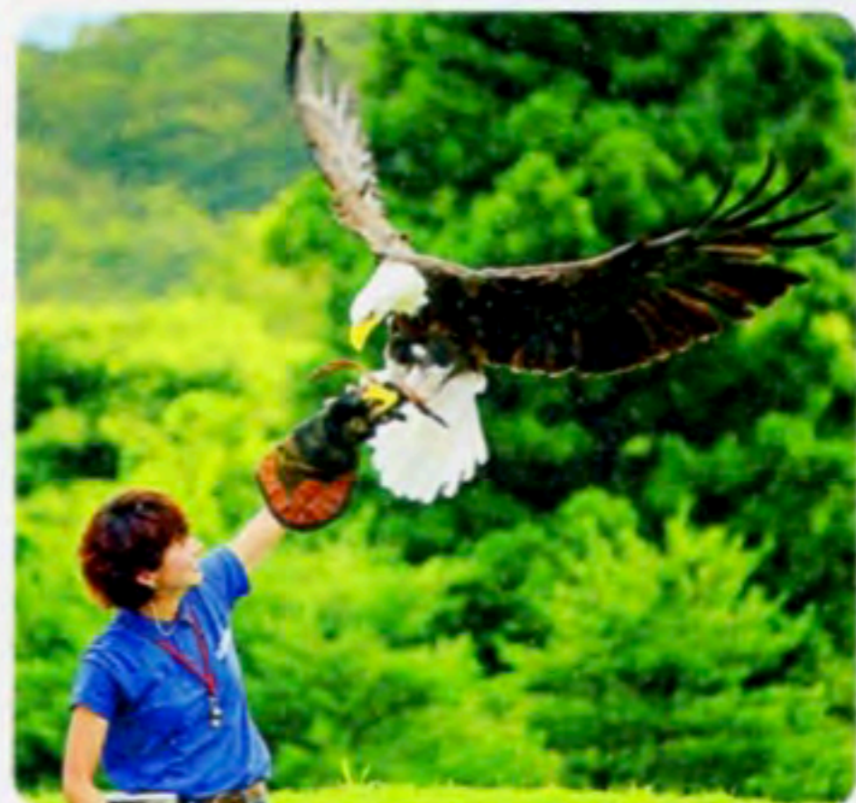
↑動物のパフォーマンスを効率よく見るなら先に開始時間をチェック!

DATA 住 栃木県那須郡那須町大島1042-1 料 入園2400円(冬期は要問合せ) 時 10時~16時30分(土・日曜、祝日は9~17時) 休 水曜(春休み、GW、夏休み、祝日は営業、冬期は要問合せ) P 2000台(有料) MAP P115B1