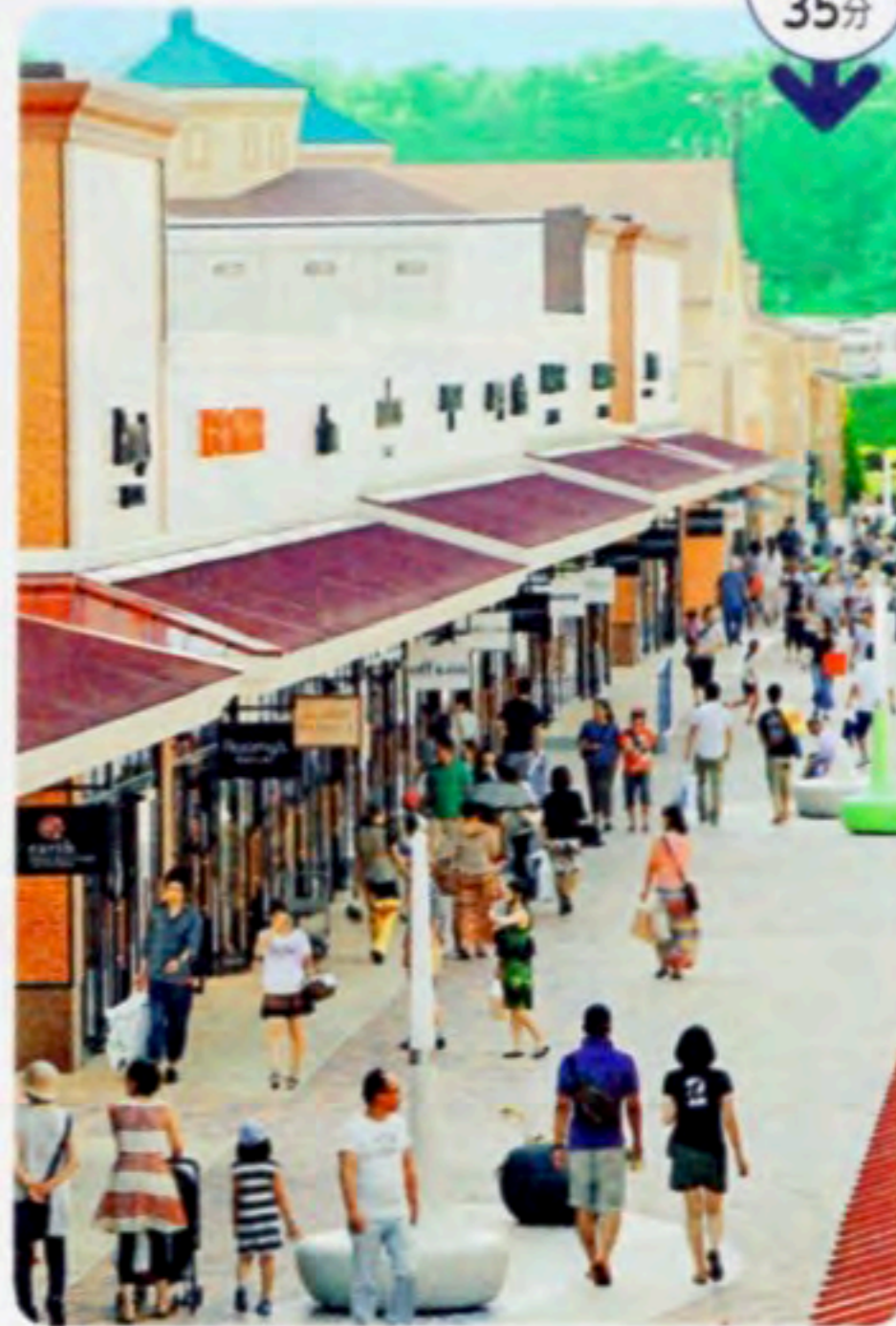
↑新規ショップも、ぞくぞくとオープンしている

DATA 住 栃木県那須塩原市塩野崎184-7 時 10~19時(季節・曜日により変動あり) 休 無休 P 2500台 MAP P115B4