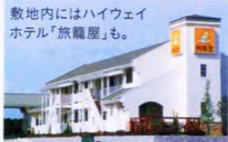
敷地内にはハイウェイホテル「旅籠屋」も。