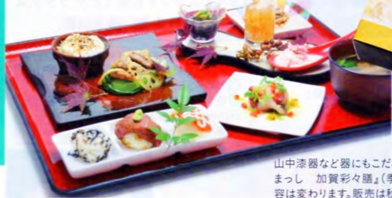
山中漆器など器にもこだわった『食べまっし 加賀彩々膳』(季節により内容は変わります。販売は秋ごろまで)

加賀らしさを感じるSAでは、自慢の和風レストランへ。「今年の第10回メニューコンテストで初優勝。地元・石川の食材をたっぷり使った懐石は旅の思い出になります」。加賀文化を感じられるグルメ、お土産がズラリ。