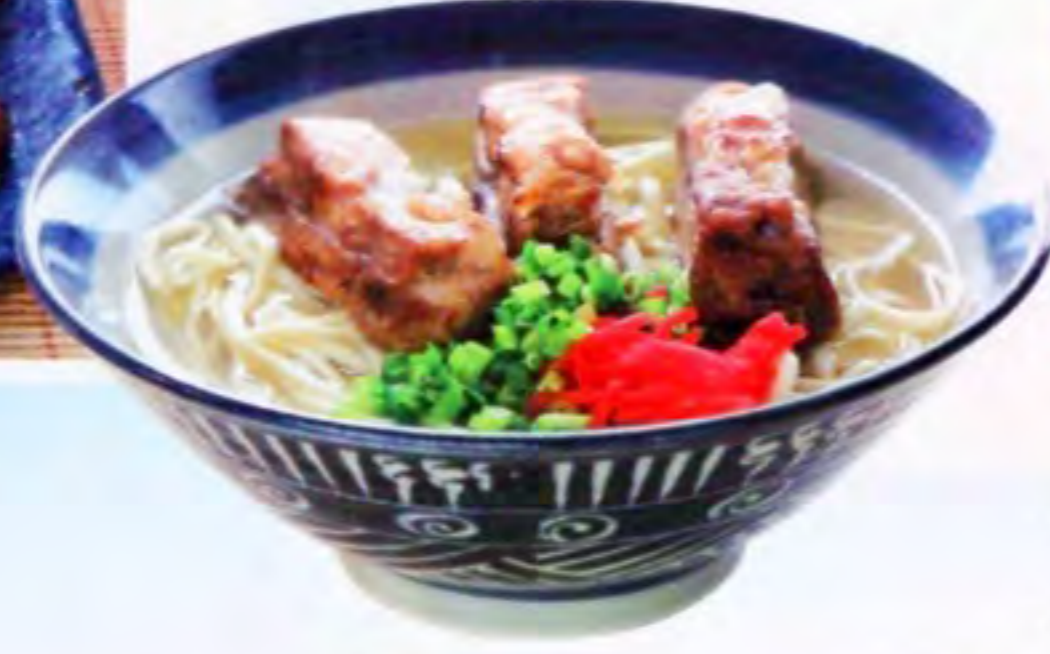
沖縄といえばこれ!『ソーキそば』700円