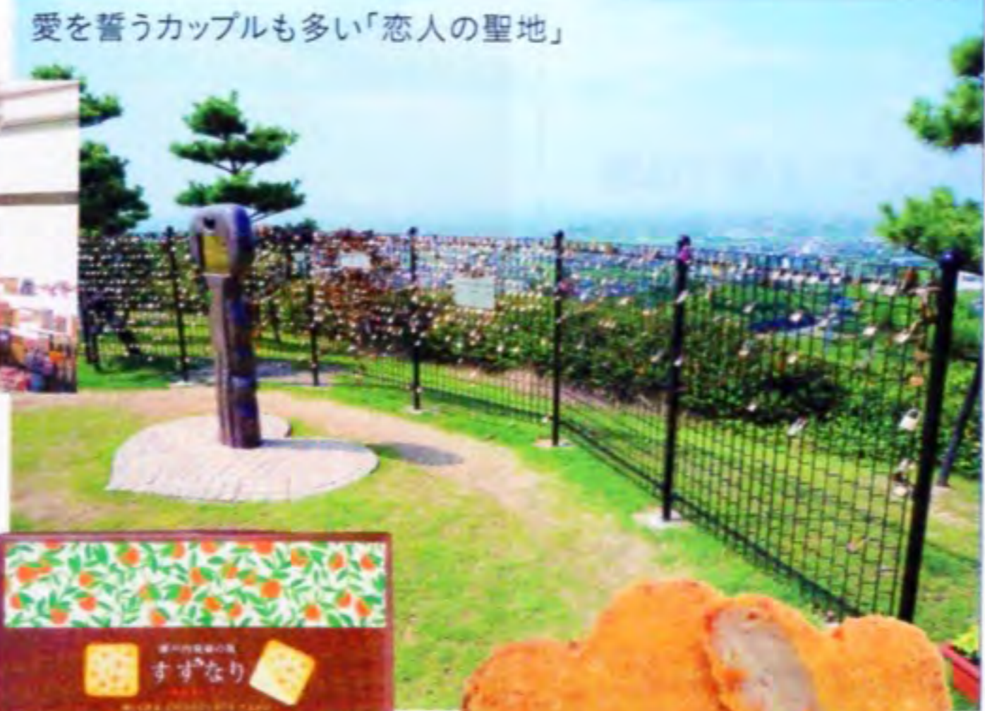
愛を誓うカップルも多い「恋人の聖地」