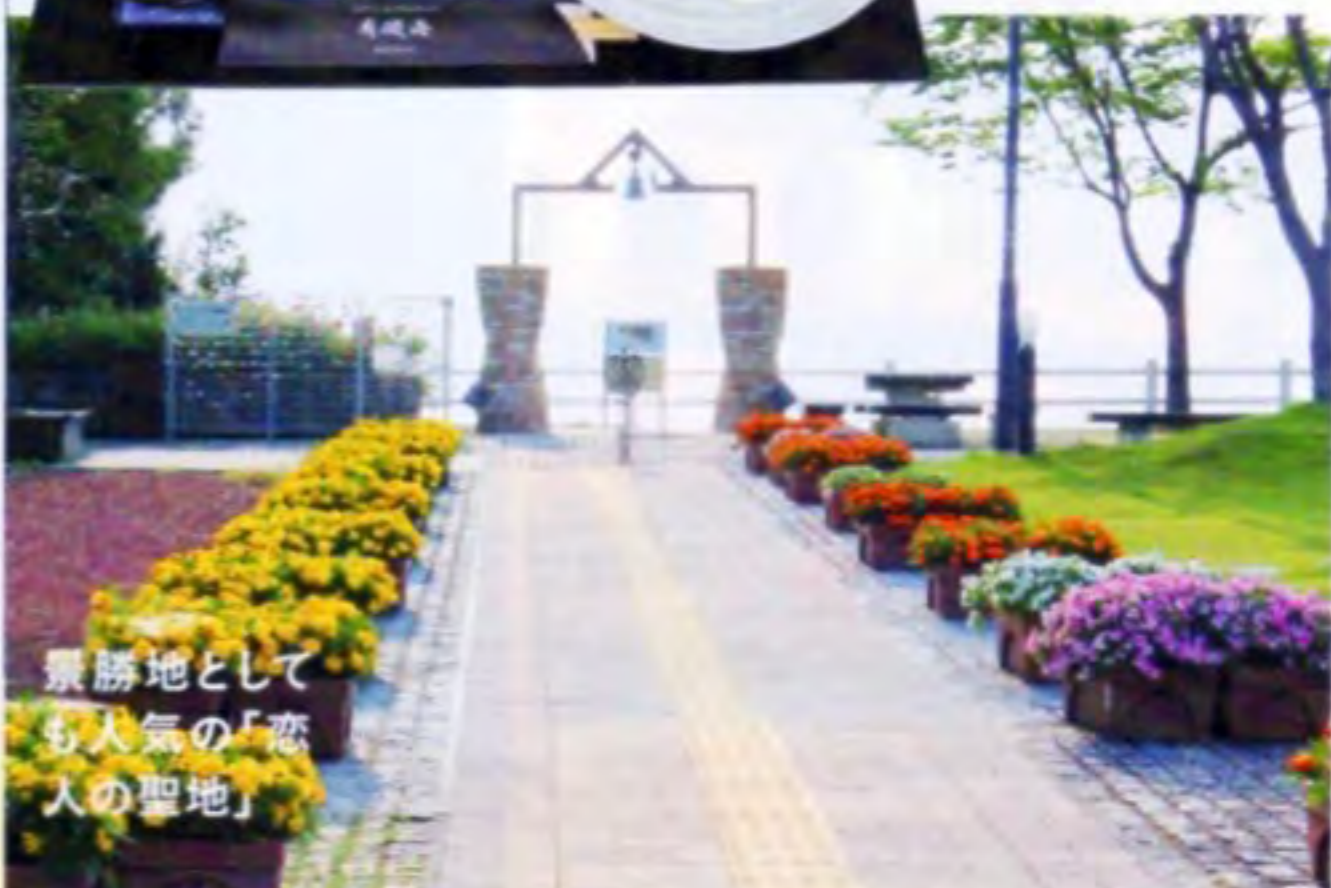
景勝地としても人気の『恋人の聖地』