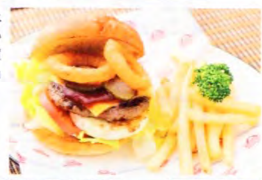
わざわざ食べに来る人もいるという『佐賀牛バーガー』1380円