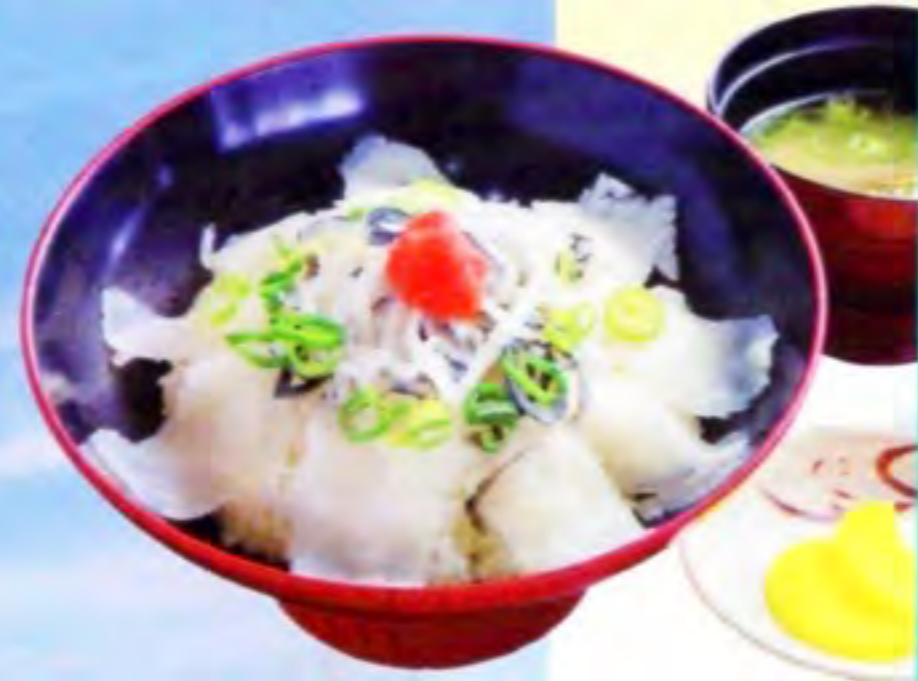
ふく刺にポン酢を合わせた人気の『ふくぶっかけ丼』1200円