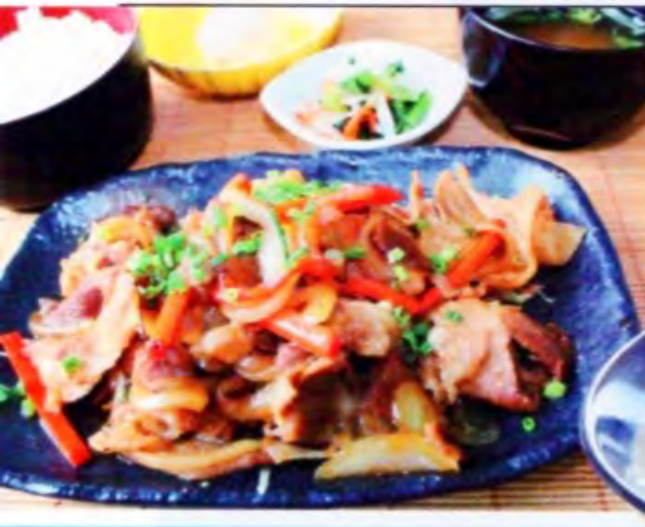
特製タレも香ばしい『あぐー焼肉スタミナ定食』820円