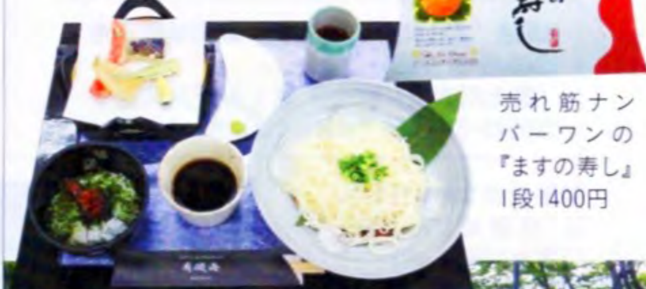
売れ筋ナンバーワンの『ますの寿司』1段1400円