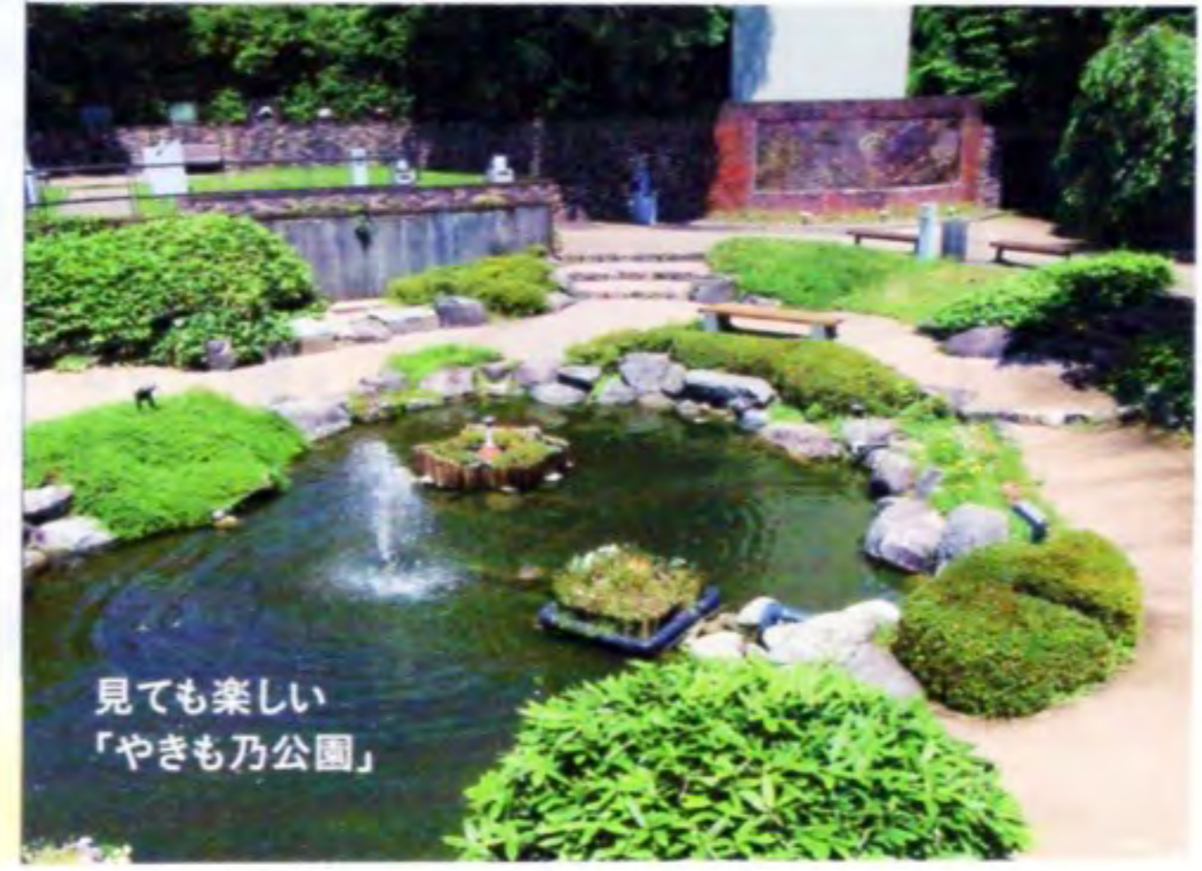
見ても楽しい「やきも乃公園」