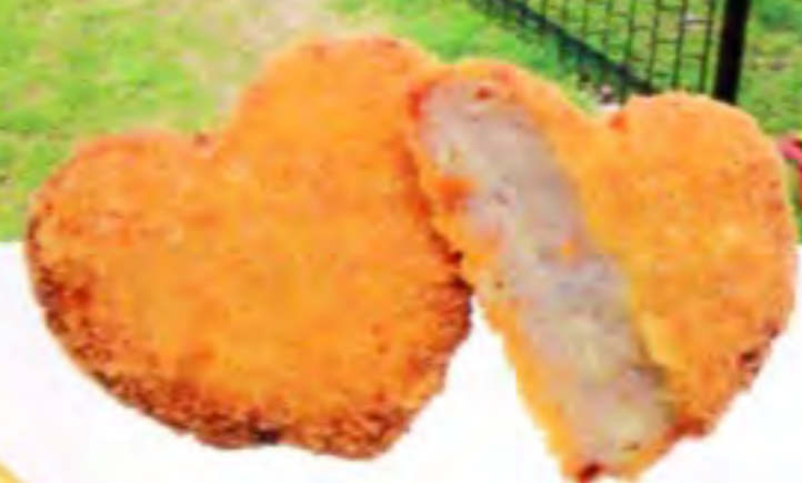
名物じゃこカツもキュートに!『ハートのじゃこかつ』1枚300円