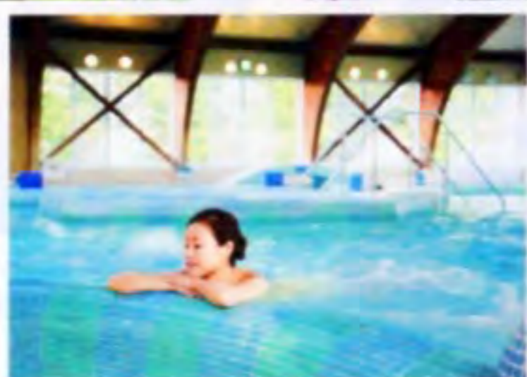
天然温泉のジェットマッサージプールで身体を活性!

DATA 「桜ヶ池クアガーデン」富山県南砺市立野原東1514 ☎0763-62-8181 温泉/6:00~22:00(最終入場21:30)、プール/9:00~22:00(最終入場21:30) レストラン11:00~14:30、17:30~20:30(L.O.) 休無休 https://sakuragaike.co.jp/