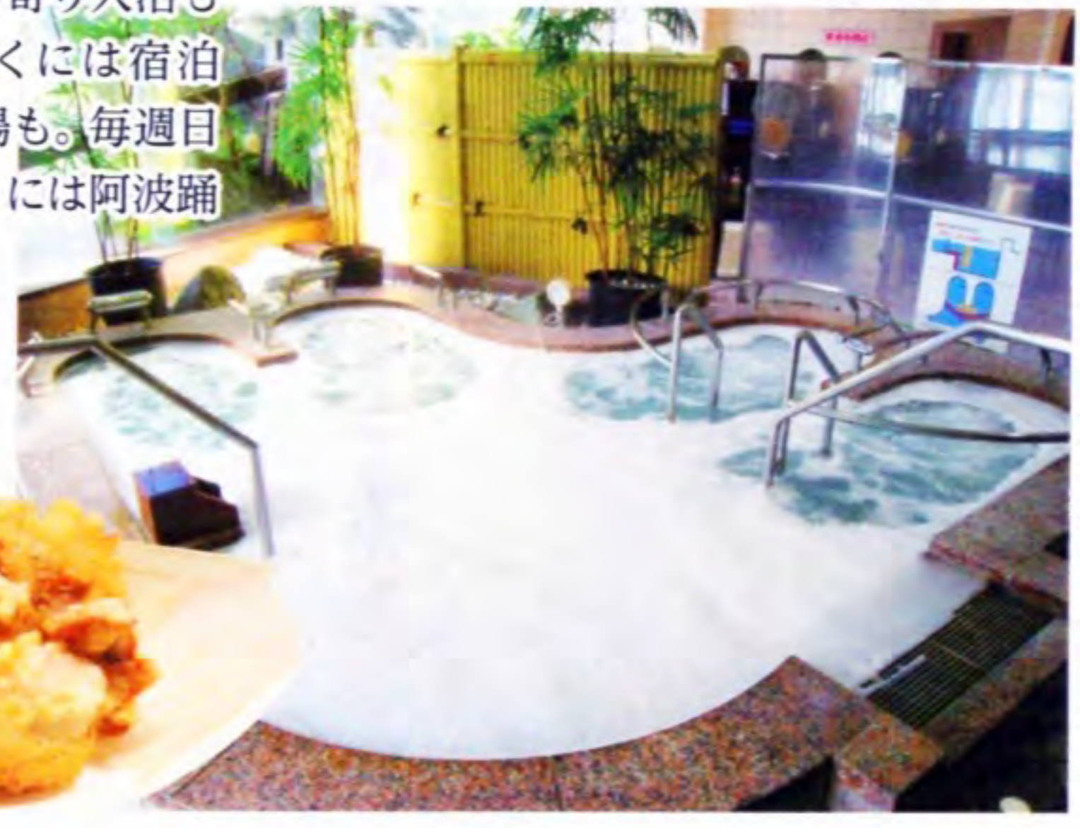
露天風呂も備えた「美濃田の湯」(大人600円)

DATA 「吉野川ハイウェイオアシス」 徳島県三好郡東みよし町足代1650 ☎0883-79-5858 9:00~21:00 施設により異なる http://www.yoshinogawa-oasis.com/