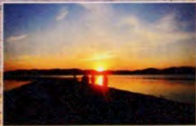
「日本の夕陽百選」選定の 牛窓の夕陽