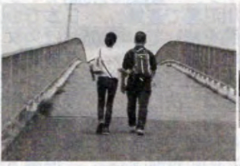
恋人の聖地 高さ日本一、「恋人の聖地」になっている中の島大橋 ②中の島大橋に行くカップル