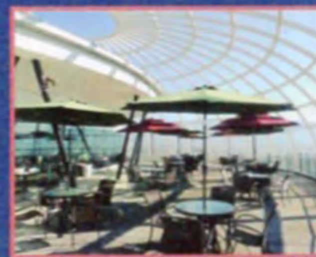
正面に位置する富士山をはじめ美しい山並みや甲府盆地を望む展望テラス席はバット同伴OK

ガッツリ大人のお子様ランチ1980円(税別)は限定30食で終日提供。富士山麓牛のステーキや甲州クリスタルポークのベーコンなど地場の味覚がたっぷり