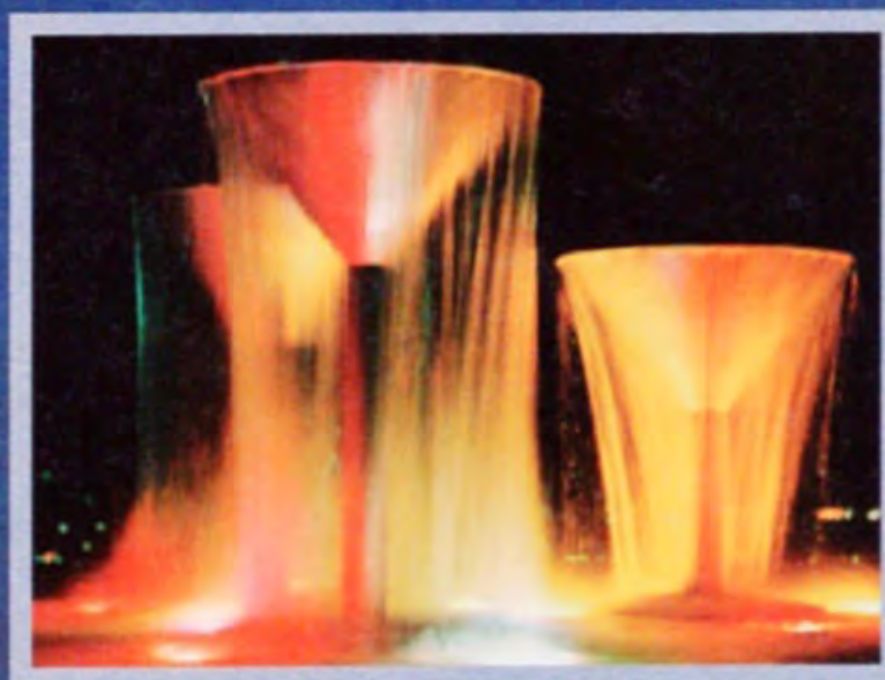
あふれるワインを思わせる、山梨らしい造形のブドウの池噴水

展 示施設や果樹園、アスレチックなど多様な施設を備える「山梨県笛吹川フルーツ公園」。夜景スポットとしても名高く、「新日本三大夜景」に認定されている。展望広場からは、富士山などの山々、甲府盆地を一望。園内のガラスドームや噴水などがライトアップされる夜はさらにロマンティックな光景で「恋人の聖地」にも認定。園内には「展望・星屑レストランガイア」や「オーチャードカフェ」(夜の営業なし)もあることで、空気が澄んで夜景が美しく見える秋こそ訪れたい。