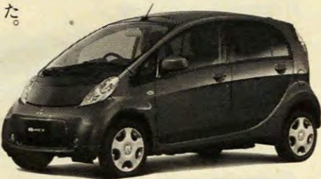
グレート展開の見直しにより、総電力量10.5kWhの「M」を廃止し、同16.0kWhの「X」のみとなった

フロントバンパーと、張り出し感のある前後フェンダーなどにより、より低重心で安心感のあるスタイリングに。フロントバンパーにはフォグランプが標準装備となった。