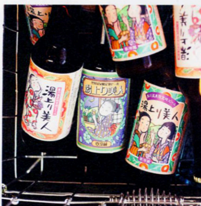
後藤酒店のクラフトビール

黒川温泉の中心街にある老舗の酒屋で、この地の湧き水を使った店オリジナルのビールを発売！ 生産は熊本市内の有名ブルワリーが請け負っているため、そのお味は本格的。フルーティなペールエールと苦味が効いた黒ビール、すっきり淡麗なピルスナーの3種が揃う。