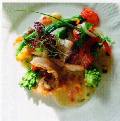
オーベルジュ マ ファソンのフレンチ

瀬の本高原に広がるリゾート施設・ココヴィラージュ内のシックな店。天草で水揚げされる魚(写真はアカハタ)やローカル野菜を使ったヘルシーフレンチがいただける。近隣の牧場で飼育されている牧草牛のミルクから作ったオリジナルのグラスフェッドバターも絶品！