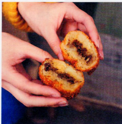
阿蘇とり宮の馬ロッケ

パワースポットとして名を馳せる阿蘇神社の門前町には老舗精肉店による馬肉のコロケが。ジャガイモの生地の内側には、醤油ダレで1日煮込んだ馬のひき肉がたっぷり！ お味は香辛料が効いたスパイシー系。注文を受けてから揚げるのでいつでも熱々のサクサク。