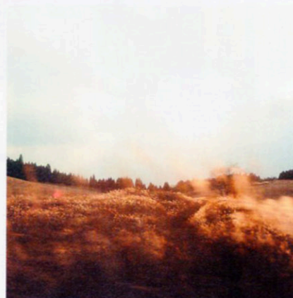
やまなみハイウェイ

阿蘇市一の宮町と湯布院を繋ぐ日本百名道にも選ばれたドライブロード。約50キロの道のりには広大な牧草地が広がり、雄大なくじゅう連山が目を楽しませてくれる。一帯が薄紫になる早朝とほんのりピンク色に染まる夕暮れどきはうっとりするほどフォトジェニック。