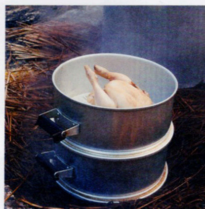
蒸鶏工房 白地商店の元祖蒸鶏

P047掲載のわいた温泉郷にある温泉の蒸気で調理を行う店。外国人観光客もこぞってオーダーするのは、鹿児島産のいづみ鶏を2時間かけてスチームした一品。大きな鶏が丸ごとでんと大皿で供されるさまはインパクトが強いが、肉質は思いのほか柔らかくどこか懐かしい味。