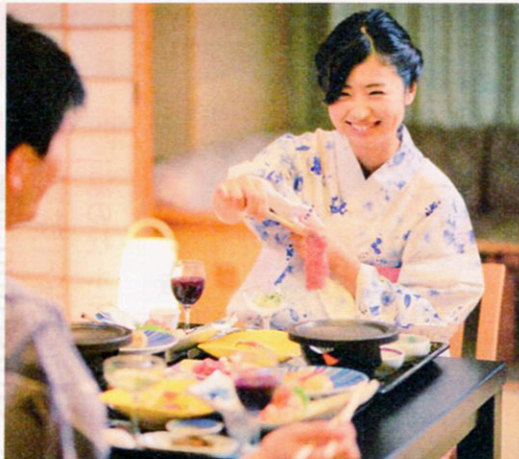
▲季節の旬素材が活かされた和膳スタイル。客室で頂ける宿泊プランも有り