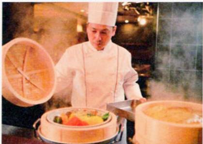
▲朝食会場「天神」のオープンキッチン。出来立ての味を朝も!