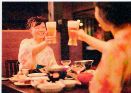
▲個別のテーブル席で、ゆったりお食事を♪かまどダイニング