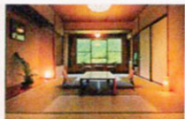
▲客室「月かんむり」(12畳)