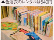
▲自由に読める絵本コーナー