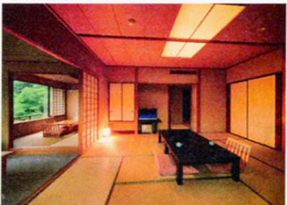
▲客室「花かんむり」二間。ベッドルーム付や禁煙ルームも有