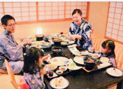
▲お部屋食なら、周囲を気にせず頂ける。まさに家族水入らず