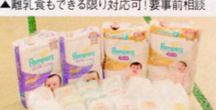
▲赤ちゃん大満足プランは、おむつ替え放題