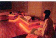
▲岩盤浴「ストーンスパ」有料