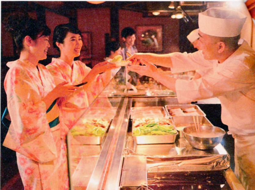
▲かまどダイニング「おむすび庵」一例。立ち込める湯気が、食欲をさらに増してくれる。アツアツを好きなだけ頂いて!