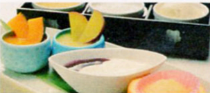
▲離乳食もできる限り対応可! 要事前相談