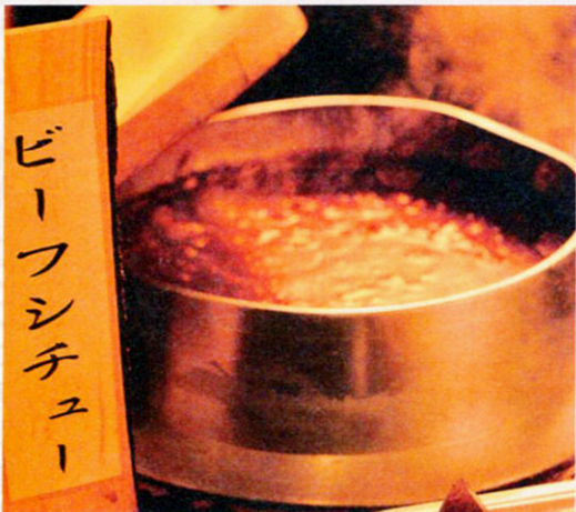
▲愛隣館名物!とろけるお肉いっぱい入って、クセになる味。リピーター多し