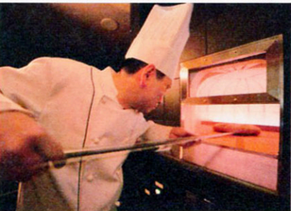
▲「石窯」と「グリル窯」の2つの窯が「天神」に。アツアツを!