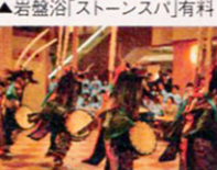
▲「お祭り広場」の郷土芸能