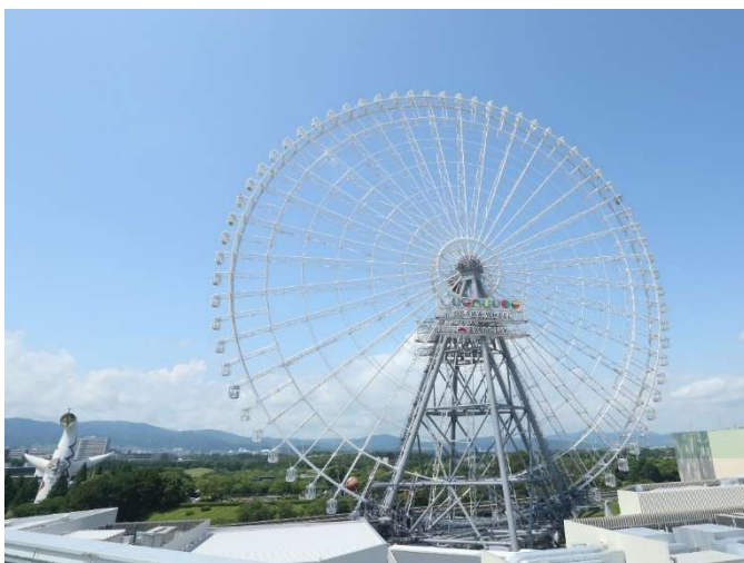
レッドホース オオサカホイール全景