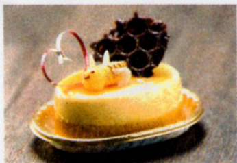
「恋人の聖地PRスイーツ」

「恋人の聖地」に登録もされた七夕神社のある小郡市。フェスタでは、「恋人の聖地」にちなんだキュートな限定スイーツがズラリ。会場周辺の広場では、地元食材グルメの出品も。入場無料