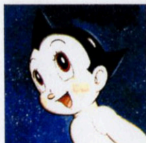
「鉄腕アトム」1979年表紙絵

「鉄腕アトム」をはじめとした作品で愛され続けるマンガ家・手塚治虫。原画や資料から、彼が未来へ託したメッセージを紹介。入場は閉館の30分前まで、月曜休館(12/25は閉館)