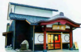
※、軒と黒い壁が周辺の雰囲気とマッチ。