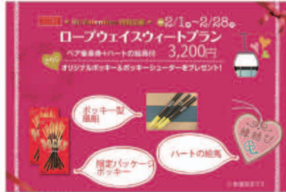
<ロープウェイスイートプラン>

バレンタインデーが近づき、恋人たちの季節がやってきました。伊豆の国パノラマパークは、恒例の「ロープウェイスイートプラン」を実施します。2月1～28日の期間中、ペア往復乗車料金がハートの絵馬、オリジナルポッキー、ポッキーシューター（ポッキー形原産）付きで3,200円とお得。※数量限定