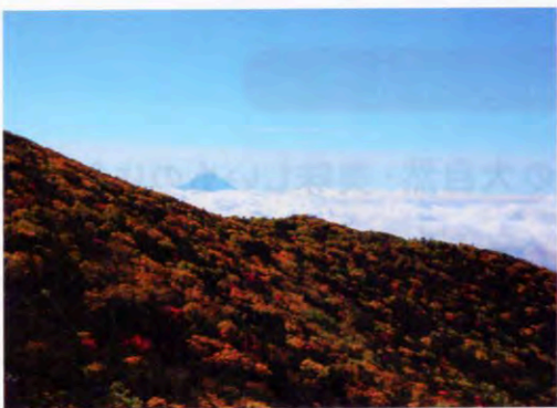
小橋山の山頂から望む幻想的な富士山。

山梨県山梨市は、恋に効く場所。その一番の理由は、山梨市が誇る豊かな自然。忙しい毎日に追われていると、つい自分と向き合う時間を忘れてしまふもの。山梨市の緑溢れる非日常空間に在るだけで、自然と本来の自分に戻り、いつも言えない自分の気持ちも素直に言葉にできそう。そして、この時季の山梨市で楽しみなのが、秋の味覚。新鮮なフルーツ、野菜やワイン。自然の恵みをたっぷり吸収して、体の中からエナジーチャージを。 素直な自分で向き合えば、いつもは見落としてしまう相手の良さにも気付けるはず。恋活ツアーに参加して、あなたも幸せをつかもう！