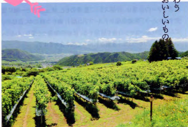
数々の国内有名ブランドを有する山梨市