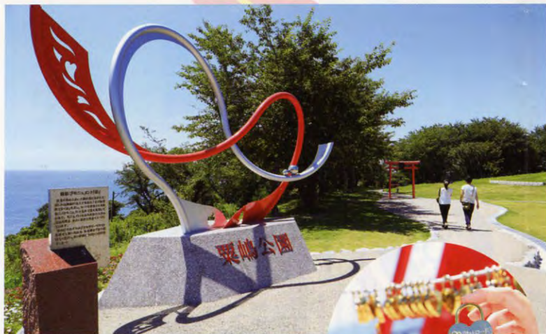
あわしま 粟嶋公園

縁結びの粟嶋神社や、ロマンティックな夕景が見られる真玉海岸など、国道213号「恋叶ロード」は、良縁を引き寄せてくれるスポットが点在する“恋人の聖地”。素敵なお縁がありますように♡