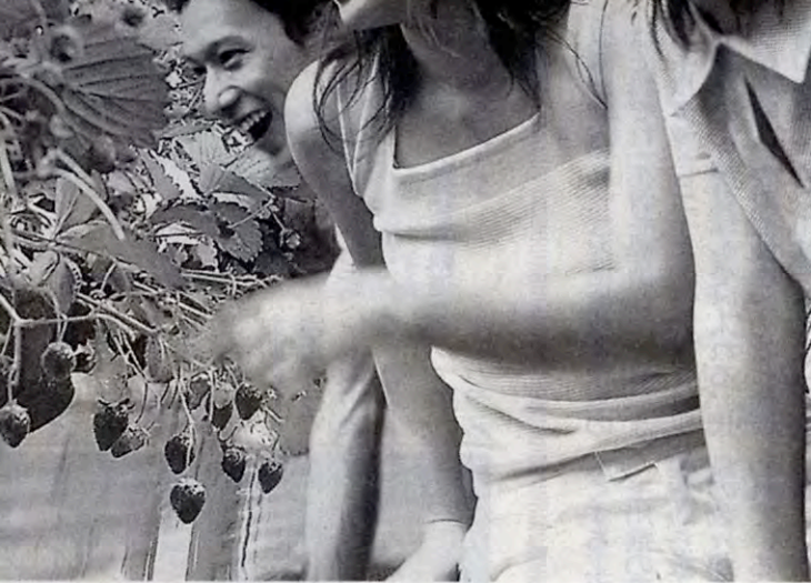
「ちこの森」でイチゴ狩りを体験