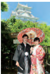
▲岐阜城をバックにした他にはない一枚を

生まれ育った岐阜ならではの街の中で、一生の記念に残るロケーション撮影を。日本の情緒を感じる街並みに合わせた、種類豊富な和装が選べたい放題のプランに注目！