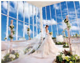
▲岐阜で唯一の高層階レストランだからこそ叶う

最上階43階、地上160mの大パノラマを眺めながらの挙式が叶う同会場の挙式スペース。昼には光が射しこも爽快な眺めを、夜にはドラマチックな夜景を望むことができる。生まれ育った岐阜の街並みと、どこまでも続く大空に包まれながら、ふたりならではの誓いの瞬間を迎えることができる