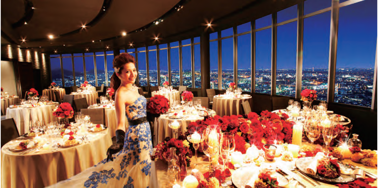
▲岐阜駅直結でアクセス抜群！夜景が美しく輝く高層階レストランでウエディングが叶うのは岐阜県内でも唯一。上質と寛ぎ溢れるパーティを叶えるための空間を提供している。もちろん昼には遥かかなたの景色も一望できる