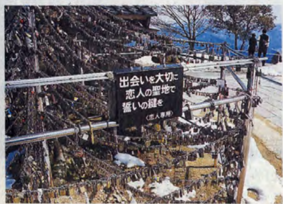
①三方五湖や残雪を頂いた山々の絶景が広がるレインボーライン山頂公園の展望台。錠を模したモニュメントがさまざまな誓いを見守る=若狭町 美浜町 梅丈岳山頂

若狭町も地元を応援しようとして、地元在住者が地元で挙げる用の一部を助成町政策推進課の事(19)は「これが山頂公園となりました。観光客さんな温かく祝す」と笑顔で話