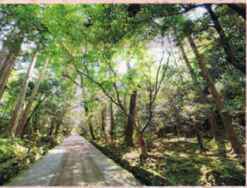
▲参道を進み、点在する重要文化財や庭園巡りへ

約400年前から伝わる恋物語があり、「恋人の聖地」に選ばれているあわづ温泉。1300年前の開湯にゆかりある那谷寺や江戸末期から続く老舗店を巡る時間旅行へ。