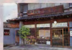
▲加賀町屋の伝統的な木虫籠まわしこと呼ばれる出格子が美しい

☎0761-65-2111 所小松市那谷町122 時12/1~2/28:8時45分~16時30分、3/1~11/30:8時30分~16時45分 休なし ①拝観料:中学生以上600円、小学生300円、小学生未満無料 ②400台