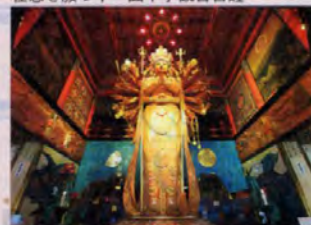
▼山門を入ってすぐ左手の金堂華王殿に祀られている、神秘的な存在感を放つ十一面千手観音菩薩