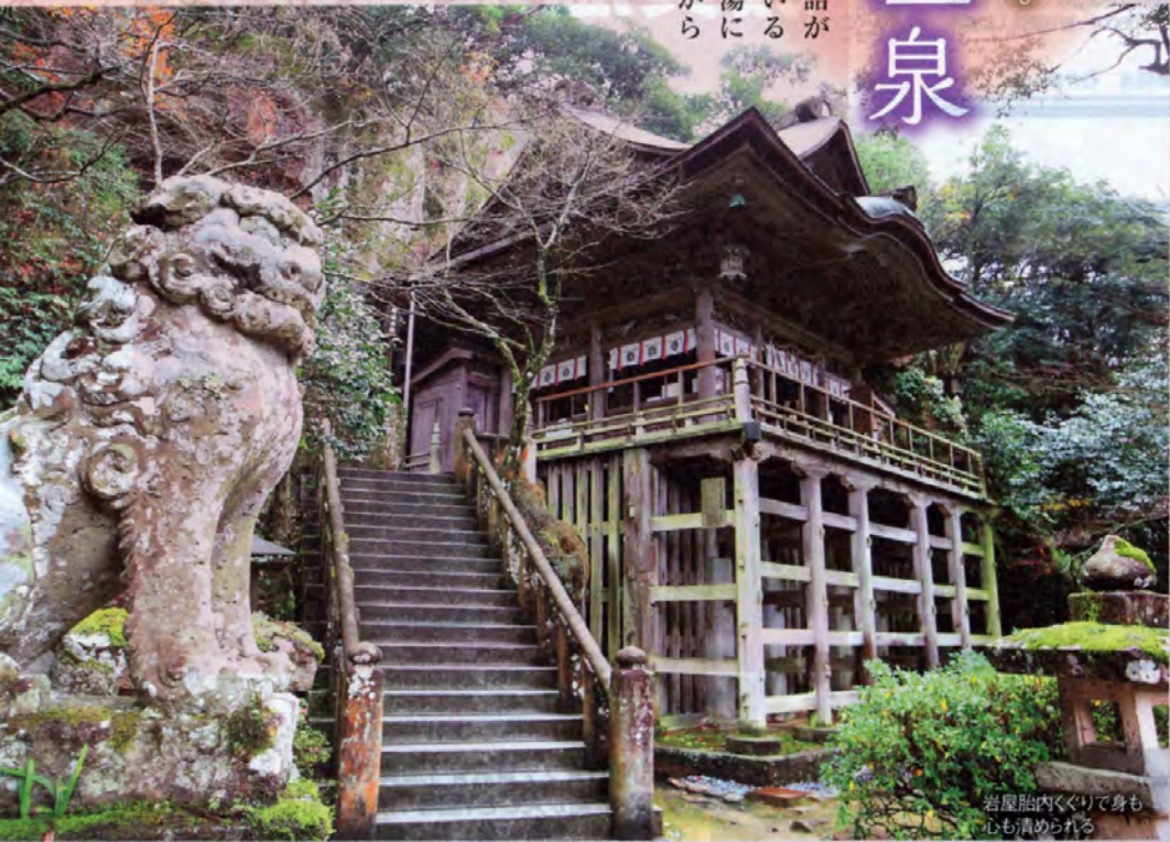
岩窟胎内めぐりで身も心も清められる