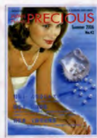
特集I—表参道ヒルズ 特集II—真珠特集 特集III—宝飾関連機器