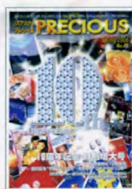
10周年記念特別増大号

また、インド・ムンバイやイギリス・ロンドンなど、世界各地のテロ事件が取りざたされる中で、国際組織犯罪やテロ等の取締りの効率化を図るものとして2006年に入国管理法が改正。法務省が警察庁の協力を得て蓄積されたデータのシステム開発に協力するといったことも行われており、2007年6月に東京都内の宝飾店で起こった2億8,000万円相当の盗難事件がICPO 及び関係外国機関との連携を図ることで犯人逮捕 国際手配されていたピンクパンサーと呼ばれる国際的武装強盗団の構成員であるモンテネグロ人の男の身柄引き渡しを受けた逮捕 (2010年8月 警視庁HP) にも繋がっている。