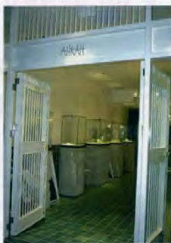
「AHKAH (アーカー)」表参道ヒルズ店 2006年夏号 [特集 表参道ヒルズ] より