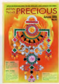
特集I—一冊特集 特集II—色石特集