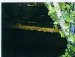
「H.P.FRANCE BIJOUX (アッシュ・ペーフランス ビジュ)」表参道ヒルズ店 2006年夏号 [特集 表参道ヒルズ] より