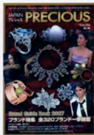
Brand Guide Book 2007