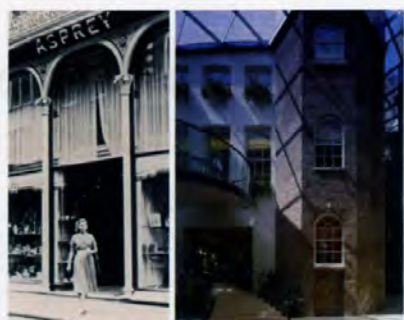
「Asprey (アスプレイ)」の2004年にリニューアルしたニューボンドストリートの本店と創業当時の様子「Chaos Bracelet」 2006年冬号 [英国特集] より