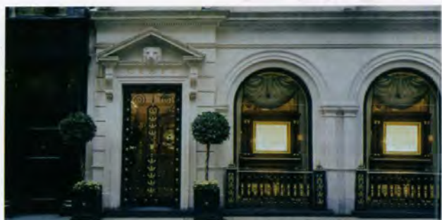
「GRAFF (グラフ)」ロンドン、ニューボンドストリート店 2006年冬号 [英国特集] より