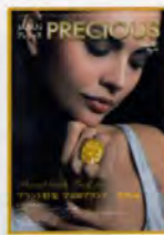
ブランド特集 全400ブランド一挙掲載 特集II—色石特集