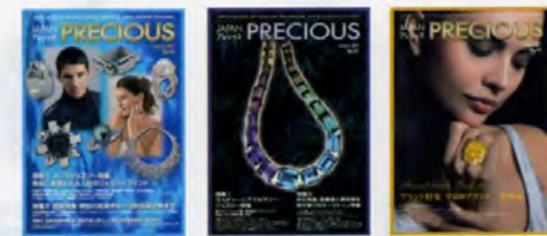
特集I—メンズジュエリー 特集II—真珠特集

世界情勢では中国国家统计局が2006年の中国の国内総生産 (GDP) の実質伸び率が10.7%と、4年連続で2桁成長となったことを発表するなど、「世界の工場」として富を得た中国の各国経済に与える影響が大きくなり、商品を提供していた中国が購買力のある魅力的な販売先として捉えられるようになった様子も表れている。2007年10月にアイプリモの台湾の店舗がオープンしており、ザ・キッスも12月にマカオ店がオープン。また、国内初の銀聯カードの発行もあった。