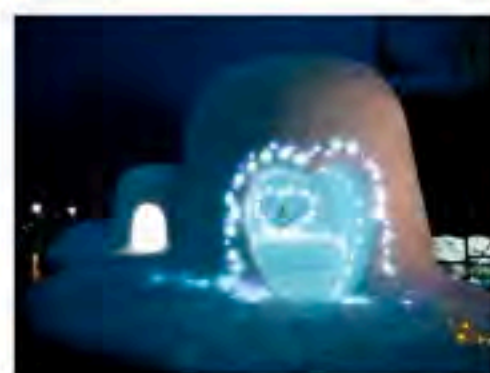
バレンタインデーに合わせて作成した「ラブかま」