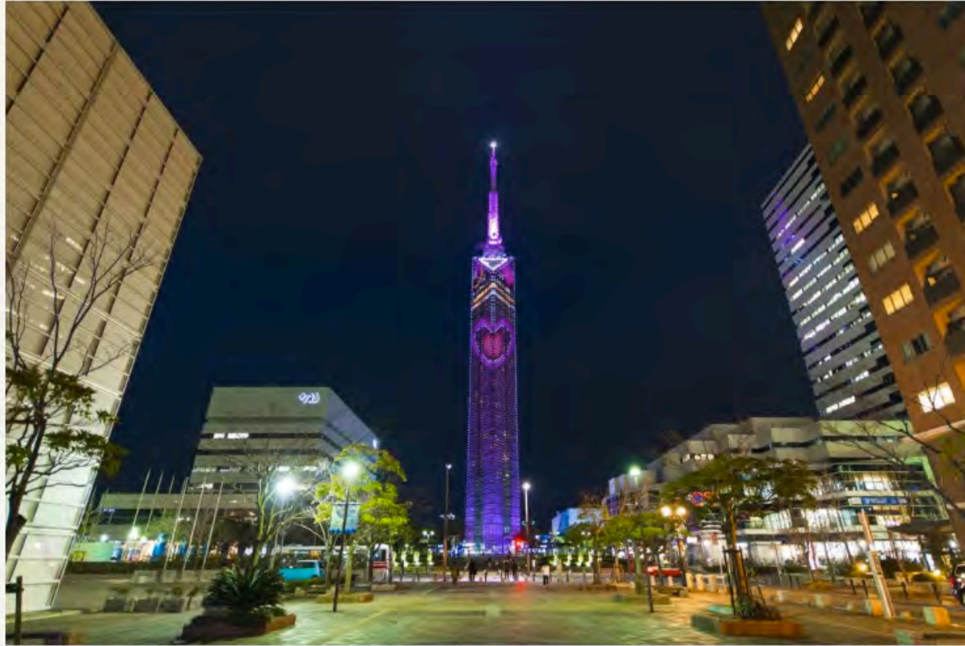
▲ ハートのイルミネーション点灯