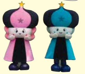
新・七夕伝説キャラクター「オリリン」「ヒコリン」

天然温泉「満天の湯」や健康増進プールなどがあり、市民の保健・福祉の拠点となっています。