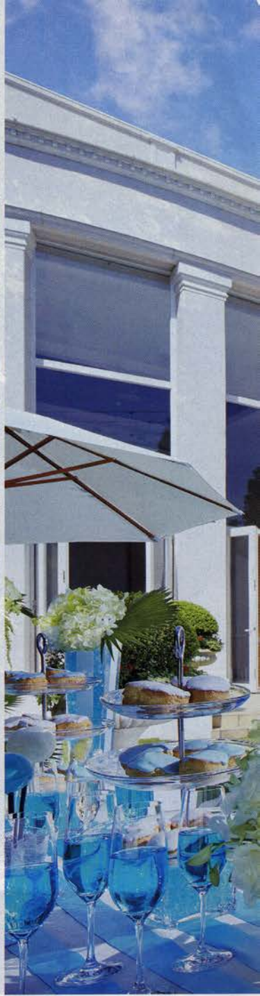
▲夜には花火が輝くサプライズなエンディングも