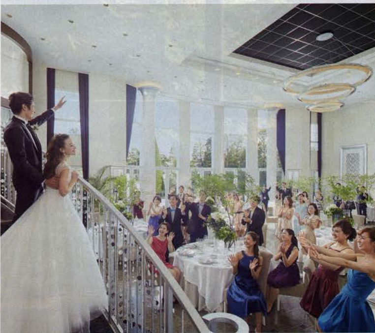
▲ドラマチックなシーンを描く大階段のほか最新音響・映像・レーザー演出設備、DJブースで盛大な演出を