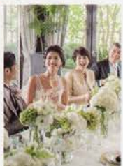
▲温かな少人数会※詳細は直接問合せ