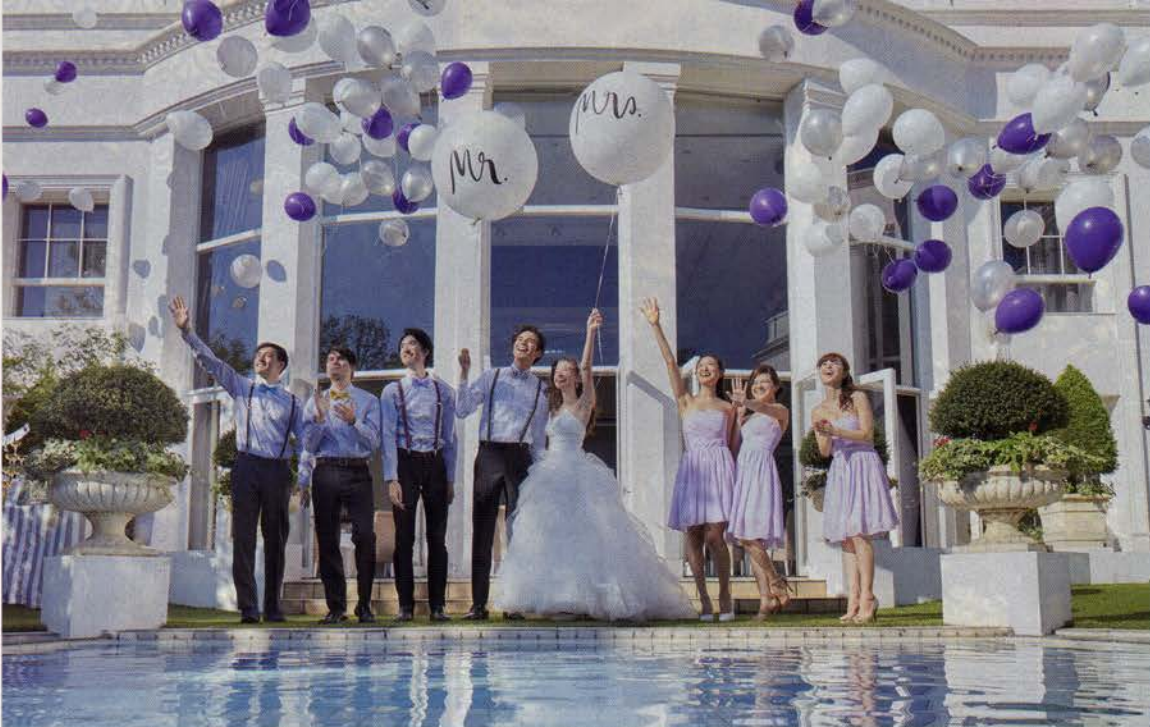
▲大空へ風船を放つバルーンリリースはゲストとの一体感をもたらすのにぴったりの演出。ゲストが喜ぶ笑顔を思い浮かべて参加型演出やアイテムを準備しよう