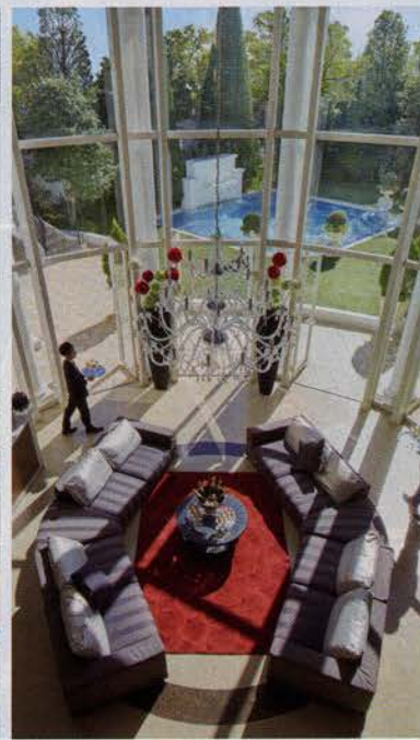
▲ガーデンとパーティ会場を繋ぐ吹抜けのロビー