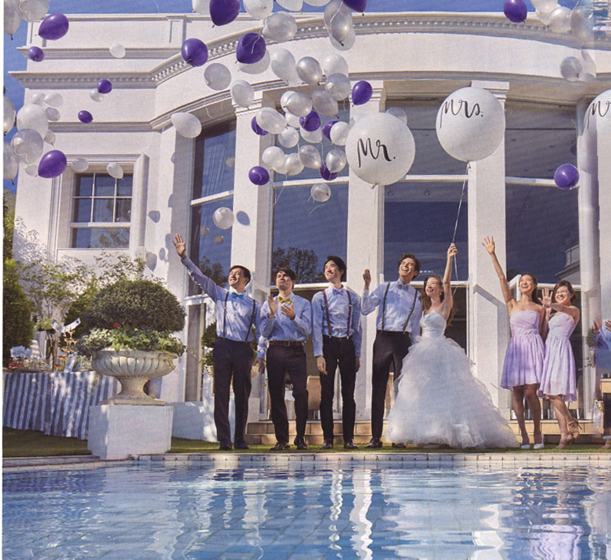
▲洗練されたアーバンスタイルをコンセプトに、上司や年配ゲストも満足な吐息をもらい一日がここなら実現。大空へ風船を解き放つ盛大なバルーンリリースをオープニングに、ハッピーな時間を大勢のゲストと楽しもう