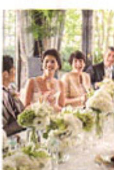
▲温かな少人数会※詳細は直接問合せ