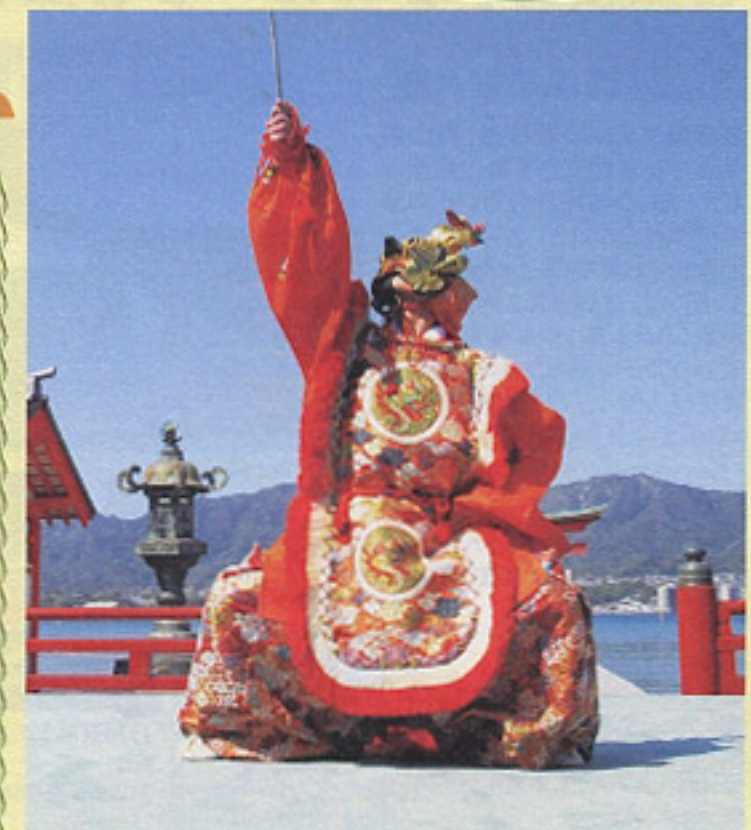
2016年12月6日厳島神社にて舞臺奉納

厳島神社・宮島では、シンポジウム・コンサート・カメラ女子旅・野村萬斎奉納狂言・観月能などを予定。2016年夏に平和記念公園東側に新たなランドマークであるおりづるタワーがオープン。遠くは宮島までを見渡せる展望スペースや、復興を遂げた街並みを見て、知って、体感できるワークショップ、広島グルメやショッピングが楽しめるフロアがそろう。