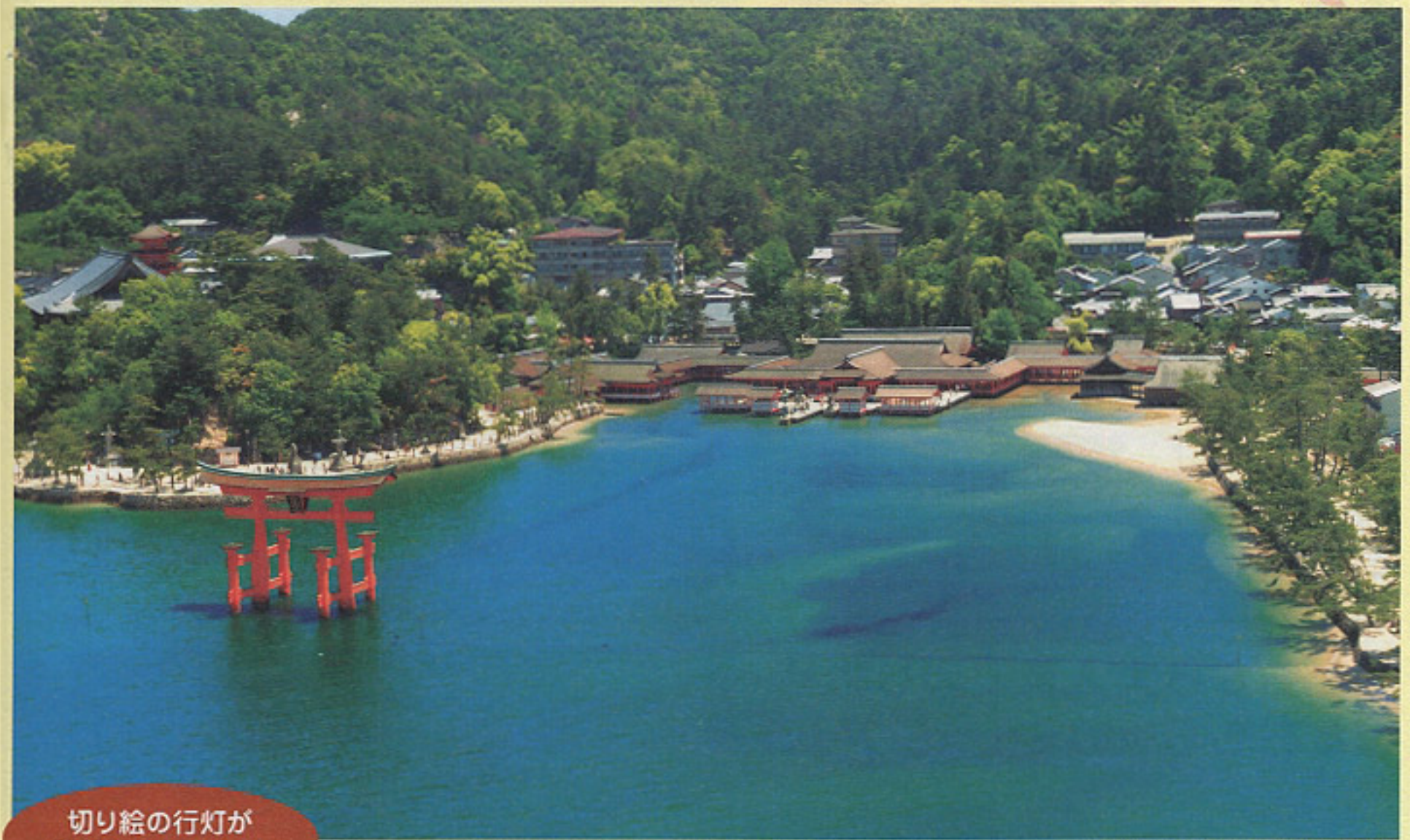
1996年に世界遺産に登録された「厳島神社」