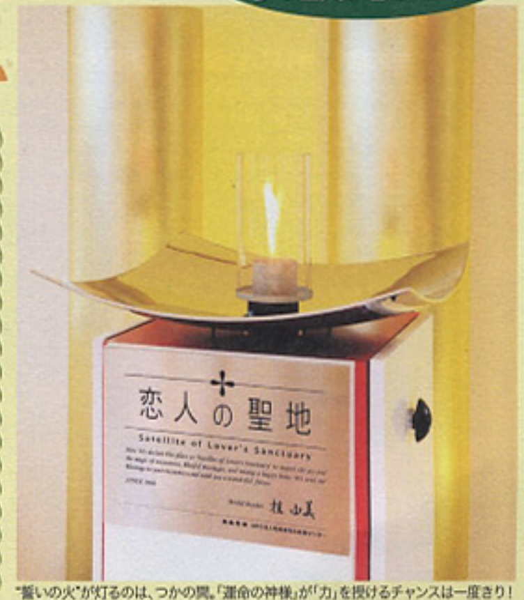
「誓いの火」が灯るのは、つかの間。「運命の神様」が「力」を授けるチャンスは一度きり!

厳島神社裏手の紅葉谷公園入口より約20分間隔で無料送迎バスを運行。宮島ロープウエー獅子岩駅(山頂駅)に2人の絆を深めるモニュメント「誓いの火」がある! 瀬戸内海の絶景と奇跡の自然パワーで、ふたりの愛の力もますますパワーアップ! カップルの絆を深めよう。まるで空中散歩をしているかのような2つのロープウエーを乗り継いで向かう、恋人の聖地への時間はドキドキ感満載!