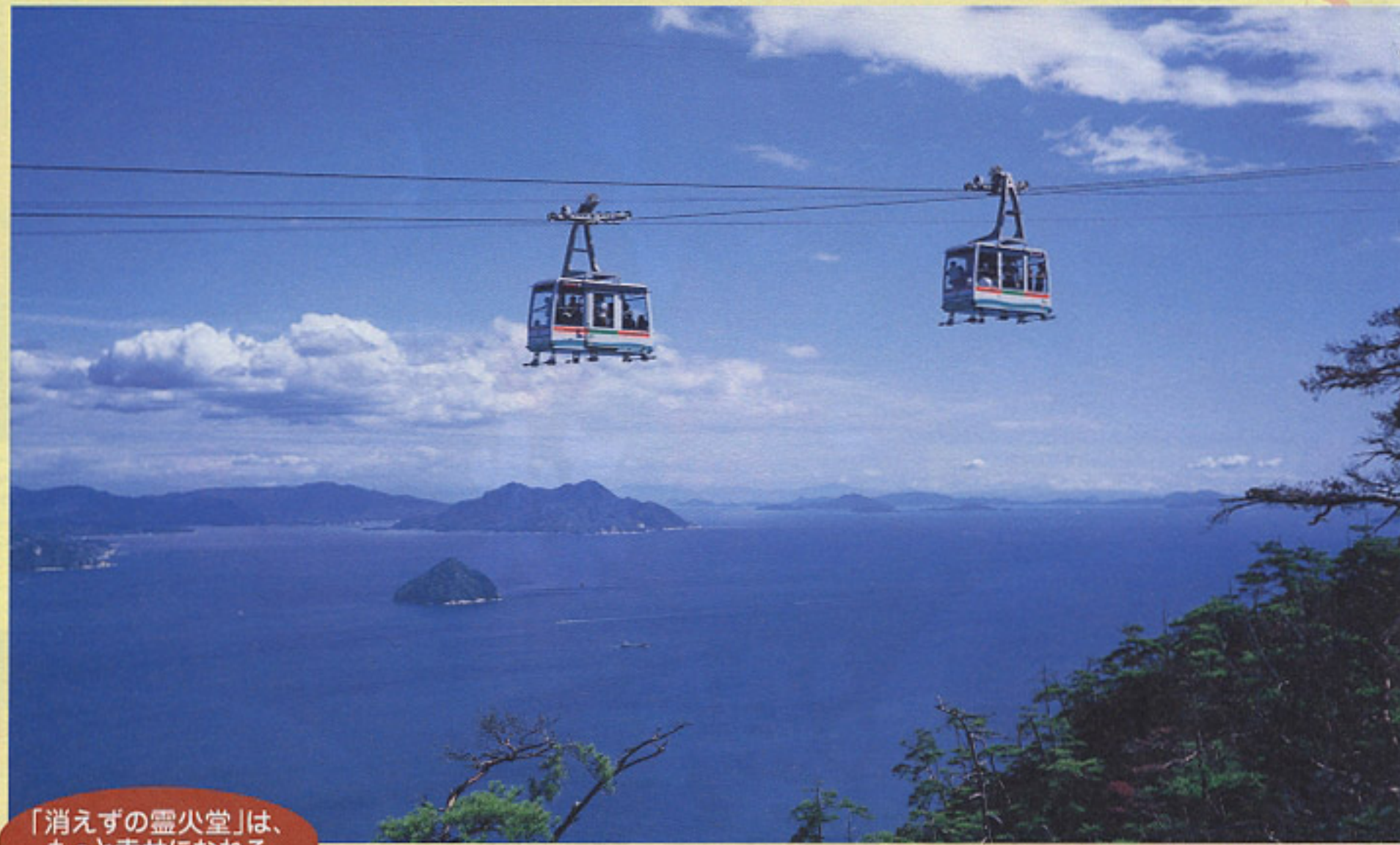
交走式ロープウエーの獅子岩線(標谷～獅子岩)