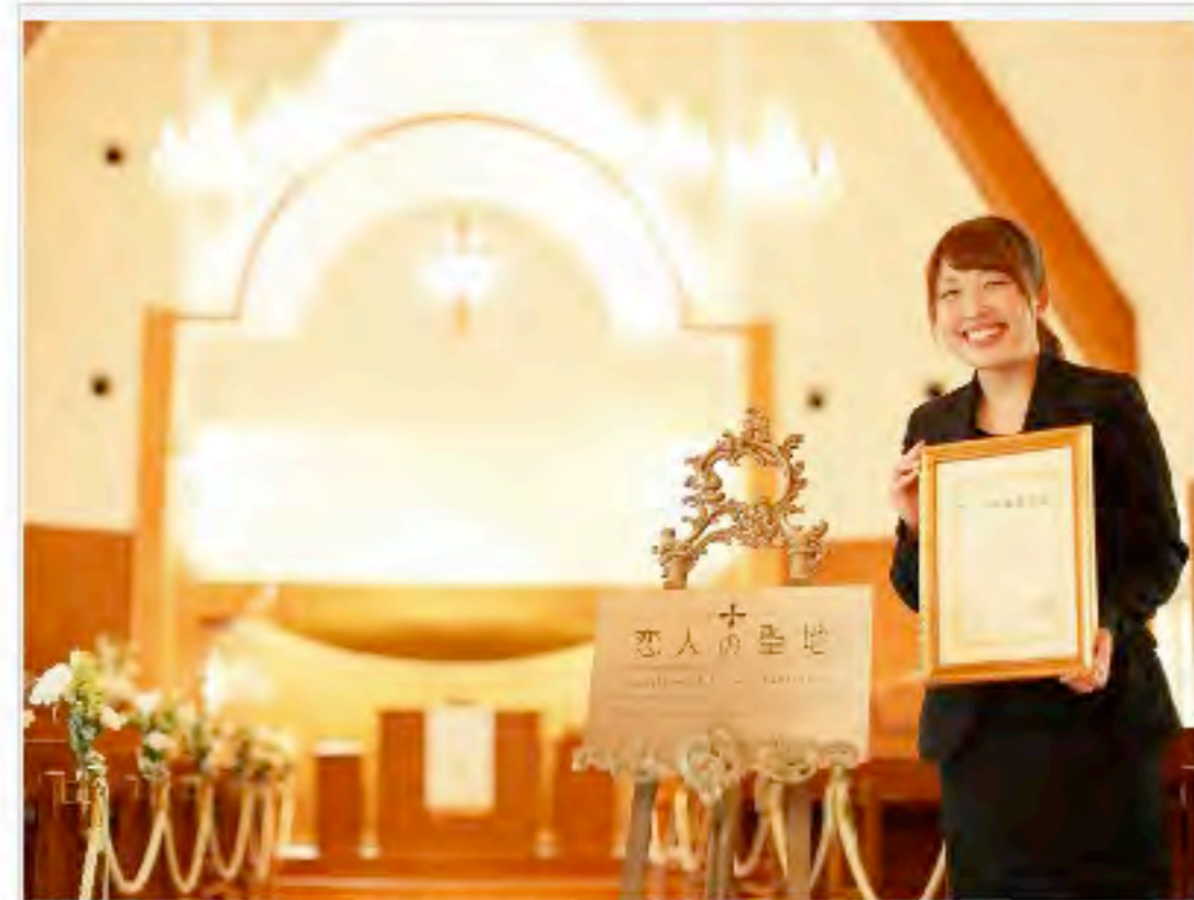
花巻温泉が「恋人の聖地サテライト」に選定されました！