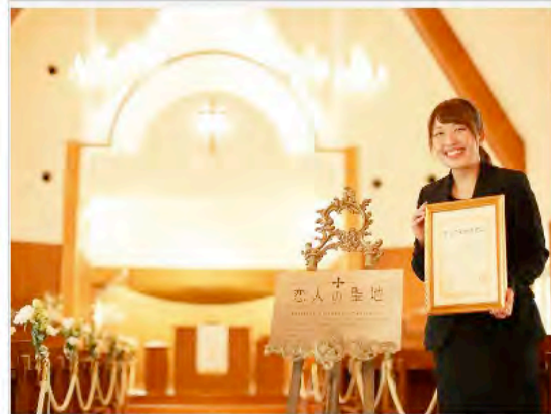
花巻温泉が「恋人の聖地サテライト」に選定されました！