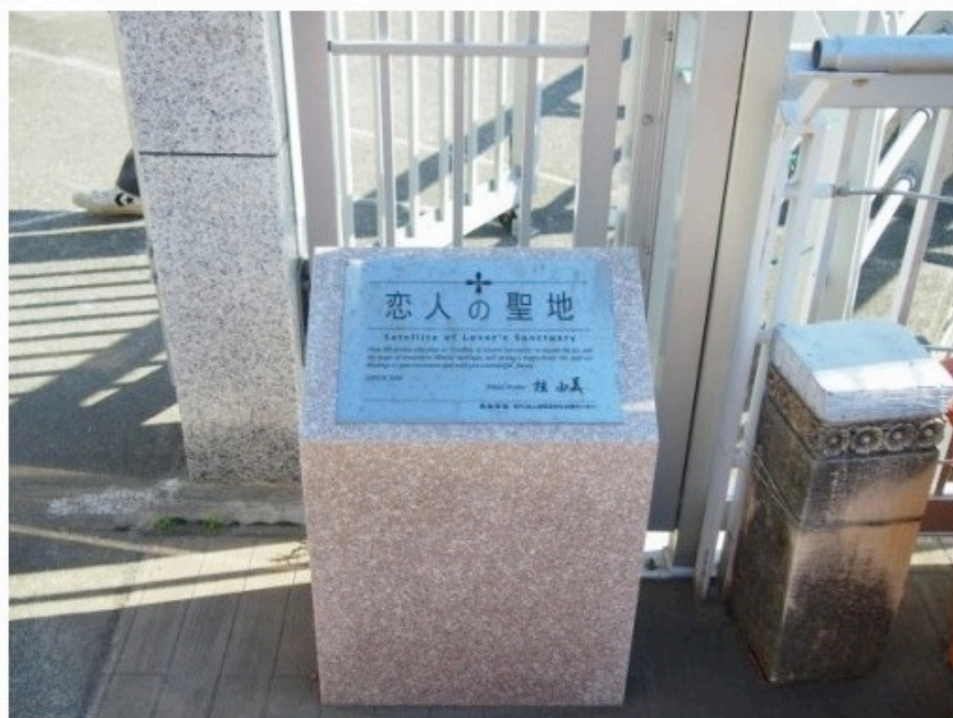
遊歩道の入口にある「恋人の聖地サテライト」の認定プレート♡