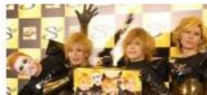
ゴールデンボンバー、走りっぱなしの汗だく会見でアクシデント 『スト』