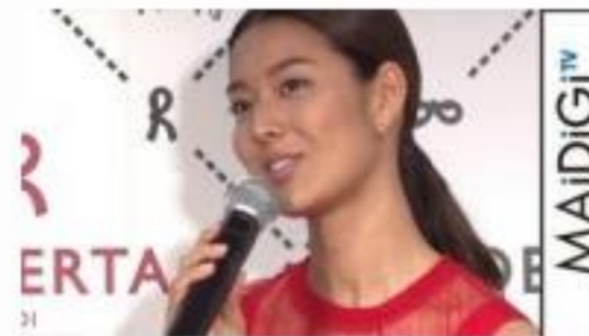
すみれ、次の「目標」は結婚? 「子ども4人は欲しい」 「ROBERTA DI CAMERINO」