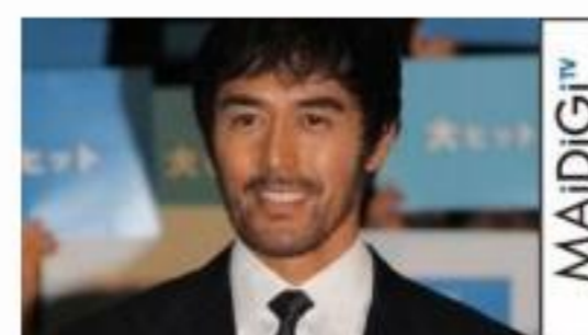
阿部寛、感激の初カンヌ振り返る 「あの経験は一生忘れない」 映画「海上りもまが深く」