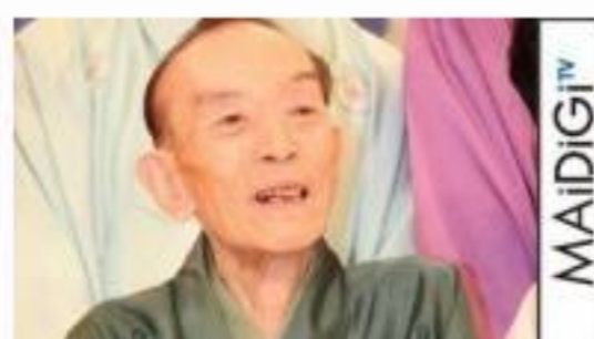
桂歌丸、最後の「笑点」放送終了後に涙 「堰切れた」 「笑点」 歌丸ラスト大喜利プレゼン