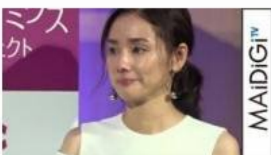
吉田羊、イベントで涙 会場からの声援に「やばい」 「WOMAN EXPO TOKYO」