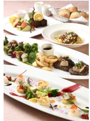
スイートディナー 料理イメージ