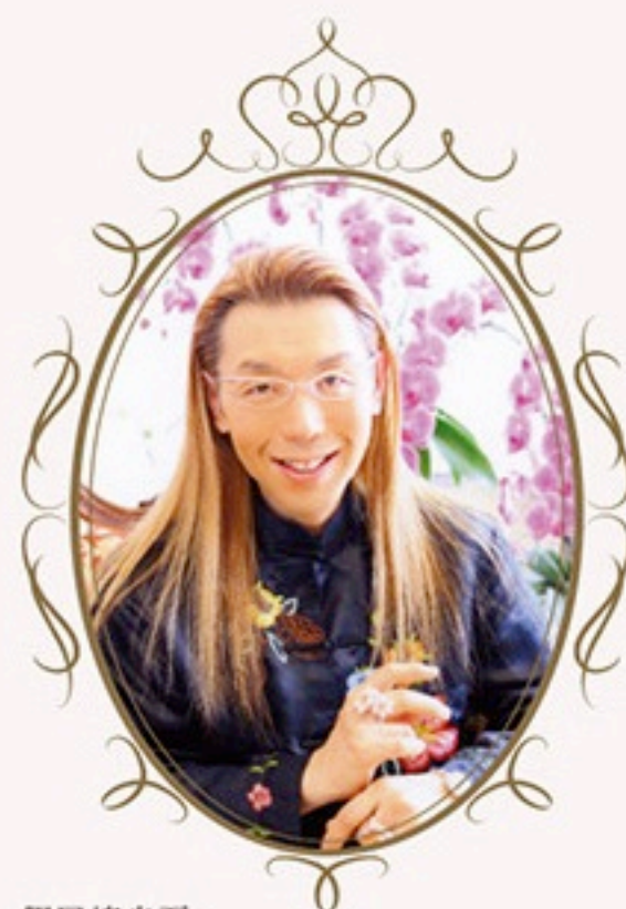
仮屋崎省吾 華道家。仮屋崎省吾 花・ブーケ教室主宰。美輪明宏氏より「美をつむぎ出す手を持つ人」と評され、繊細かつ大胆な作風と独特の色彩感覚には定評がある。クリントン元米大統領来日時や、天皇陛下御在位 10 年記念式典の花の総合プロデュースなどを手掛け、国内外からも高い評価を得ている。