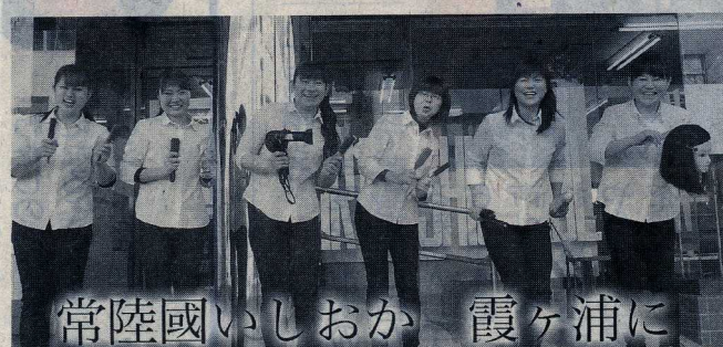
浦ヶ霞 いしおか恋瀬姫音頭を踊る