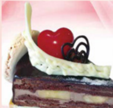
ニューモンブラン