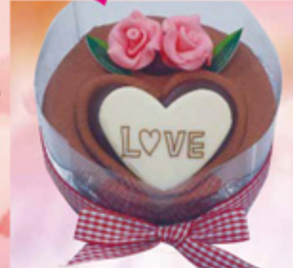
イトワールまっちゃん

下記のケーキショップさんのご協力で海王丸をイメージしたバレンタインスイーツを創作して頂きました。