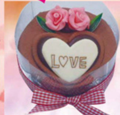
イトワールまっちゃん

下記のケーキショップさんのご協力で海王丸をイメージしたバレンタインスイーツを創作して頂きました。