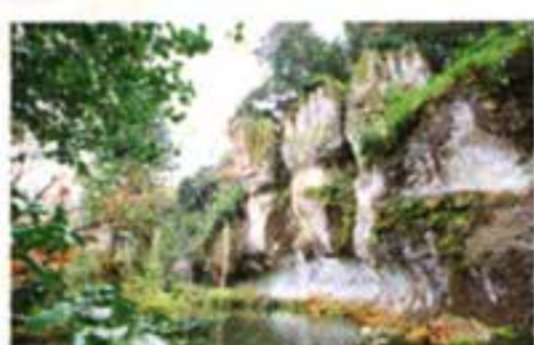
▲1500万年前の岩盤を風や砂が侵食し、生み出した自然の造形美 ▼境内を一望できる鎮守堂