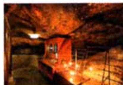
▲本殿の岩窟を一周する「胎内くぐり」で真っさらな自分に

歴史ある本物に触れる時間を求めて、開湯1300年のあわづ温泉とおとなの隠れ家的町へ。建築、芸術、美食…知的好奇心が刺激される、おとなの趣味旅へ参りましょう。