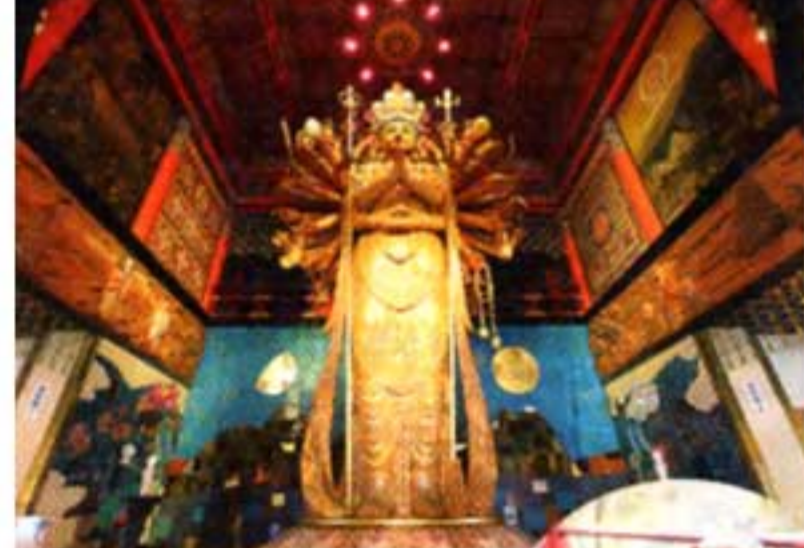
▲木曾檜で造られた千手観音像▶大工さんの置き土産「木組みの猿」がどこかにいるよ