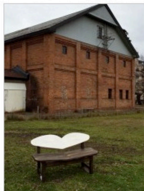
吉野町緑地公園にできた恋人のベンチ