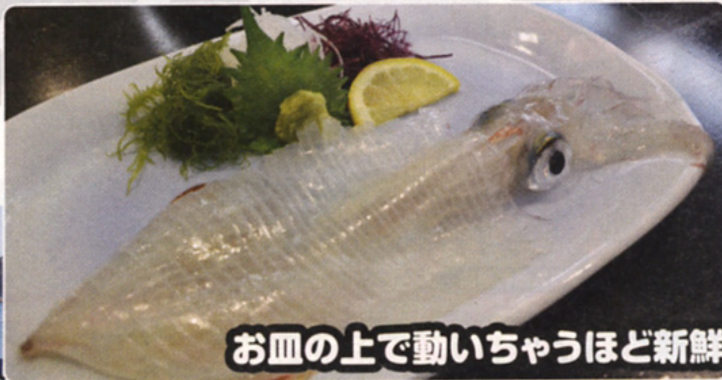
お皿の上で動いちゃうほど新鮮!

イカの町・呼子に来たらイカを食べずにはられない! ということで、イカの活け造り提供店がスタンプナワバリーのポイントになっています。ただし、実施しているのは台紙に書かれた11店舗なのでご注意ください!