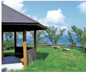
01. あげぼの展望台 AKEBONO OBSERVATORY

あげぼの展望台は、鶺倉園地を登っていくとはじめに現れる展望台。鶺湾(にえわん)と太平洋の方向が眺められる。