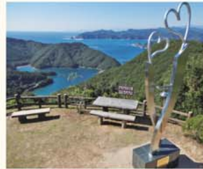
03. 見江島展望台 MIESHIMA OBSERVATORY

かさらぎ展望台からは、鶺湾(にえわん)方向に南島大橋と阿曾浦大橋の赤い親子大橋が眺められる。