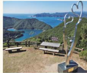
03. 見江島展望台 MIESHIMA OBSERVATORY

かさらぎ展望台からは、鶺湾(にえわん)方向に南島大橋と阿曾浦大橋の赤い親子大橋が眺められる。