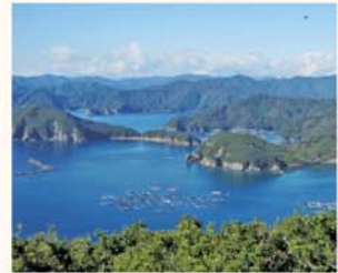
04. たちばな展望台 TACHIBANA OBSERVATORY

見江島展望台からは、かさらぎ池(ハートの入り江)が眺められる。朝から夕陽が差すまでがおすすめ。冬になると、池の中にあおさのりそだが見られる。