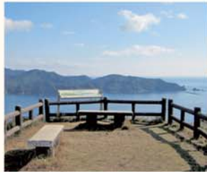
02. かさらぎ展望台 KASARAGI OBSERVATORY

あげぼの展望台は、鶺倉園地を登っていくとはじめに現れる展望台。鶺湾(にえわん)と太平洋の方向が眺められる。