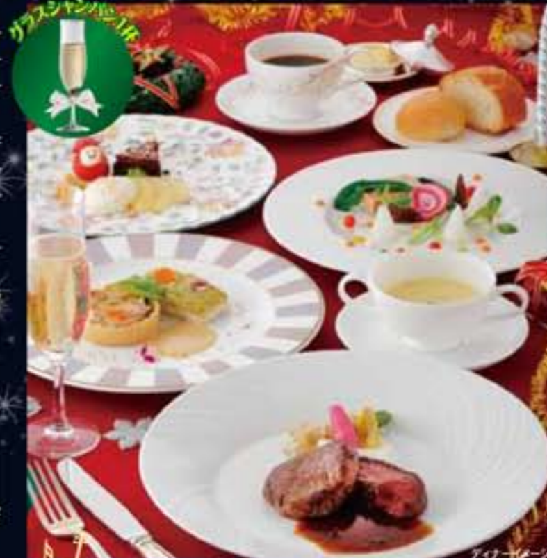
ディナーメニュー

オードブル、スープ、お魚料理、お肉料理、 クリスマスデザート、パン、コーヒー又は紅茶