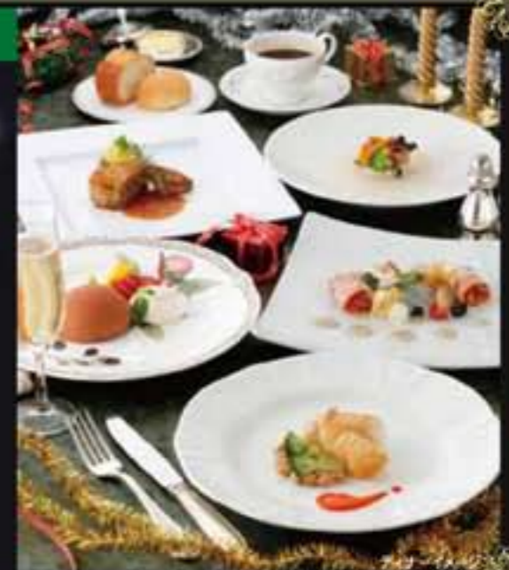
ディナーメニュー