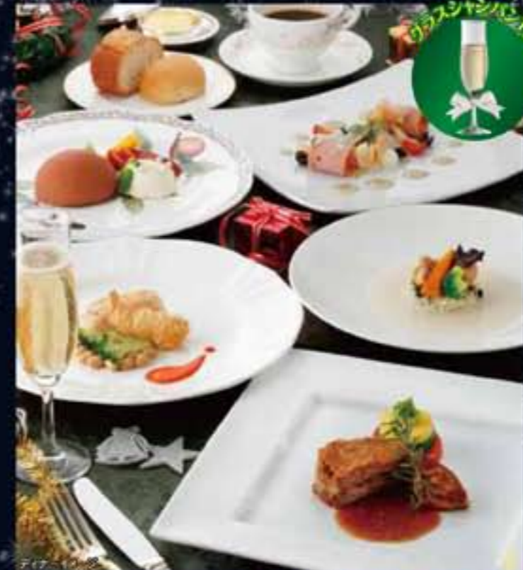
ディナーメニュー

オードブル、リゾット、お魚料理、お肉料理、 クリスマスドルチェ、パン、コーヒー又は紅茶