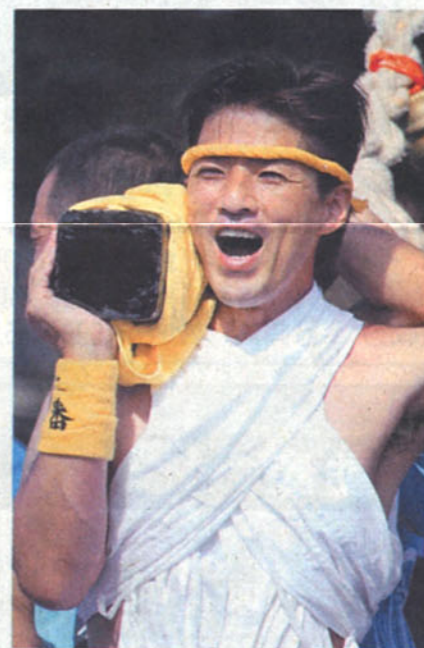
キヤノンEOS Kiss X 4、35-280mmズーム、F8、800分の1秒、ISO800

今年の夏は台風の影響などで日照時間も少なく、思い通りの撮影ができず苦労されたかと思えます。今回は「夏」がテーマで応募総数は42通でした。夏祭り、水遊び、ヒマワリを題材にした作品が多かったようです。特に祭りの作品が目を引きました。躍動感が伝わる作品が少なく感じましたが、表情豊かな人物を撮影した作品が多く、祭りの会場で目の付け所や切り取り方でこんなに祭りの見え方が変わるのかと感心しました。夏ハテ気味の審査員へ元氣の出る「夏」のお裾分けをありがとうございました。