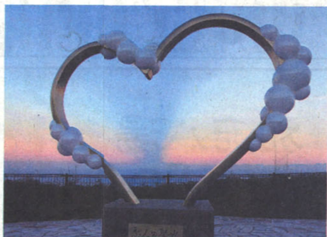
キヤノンEOS 1D マークIV、EF24-110mmズーム、F5.6、1/600分の1秒、ISO8000