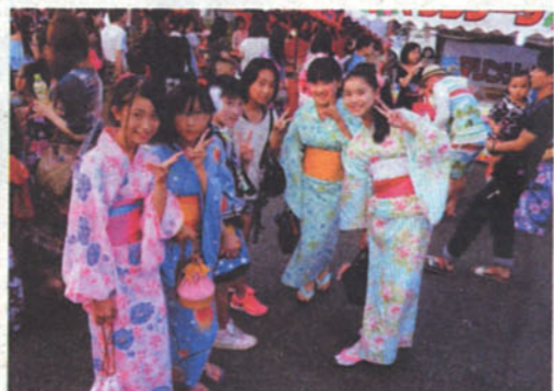
「夏まつり」 滝昭二 (宇佐市)