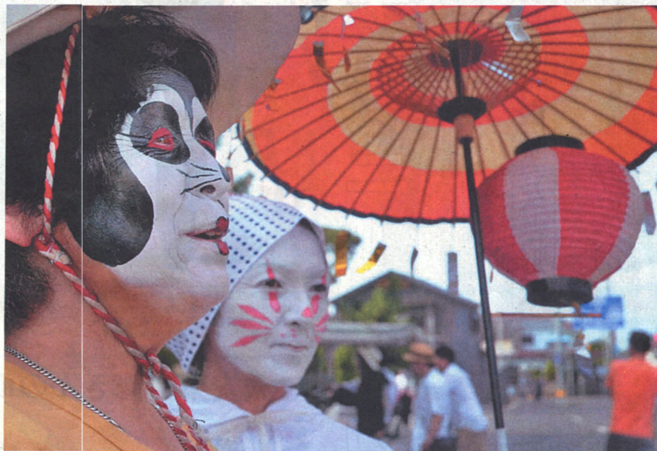
ニコンD300s、AF-S16-85mmズーム、F5.6、250分の1秒、ISO400

ろうか?と、見れば見るほど想像が膨らみ引き込まれてしまいます。これほど強烈な被写体に「踊らされ」ることなく、キツネ踊りに不可欠なカラフルな和傘とちょうちんが気持ち良い場所に収まっています。冷静にしっかりした構図の作品になっています。(写真映像センター・元木隆介)