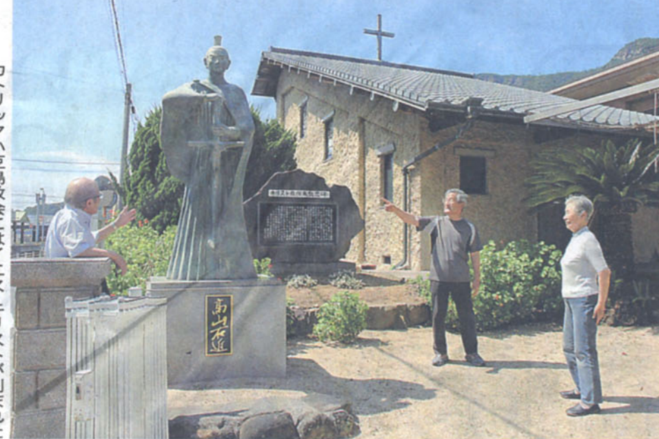
カトリック小豆島教会にはイエス・キリストが刻まれた刀を持つ高山右近像が立つ。土庄町測崎

■寒霞溪 日本三大溪谷美の一つに数えられる景勝地。奇岩怪石に約50種類の紅葉植物が自生する。山頂と麓を結ぶロープウエーの客車が今年30年ぶりに新調された。ヤマザクラにちなんだ桜色の真新しい客車で溪谷美を空中散歩できる。料金は中学生以上片道750円ほか。