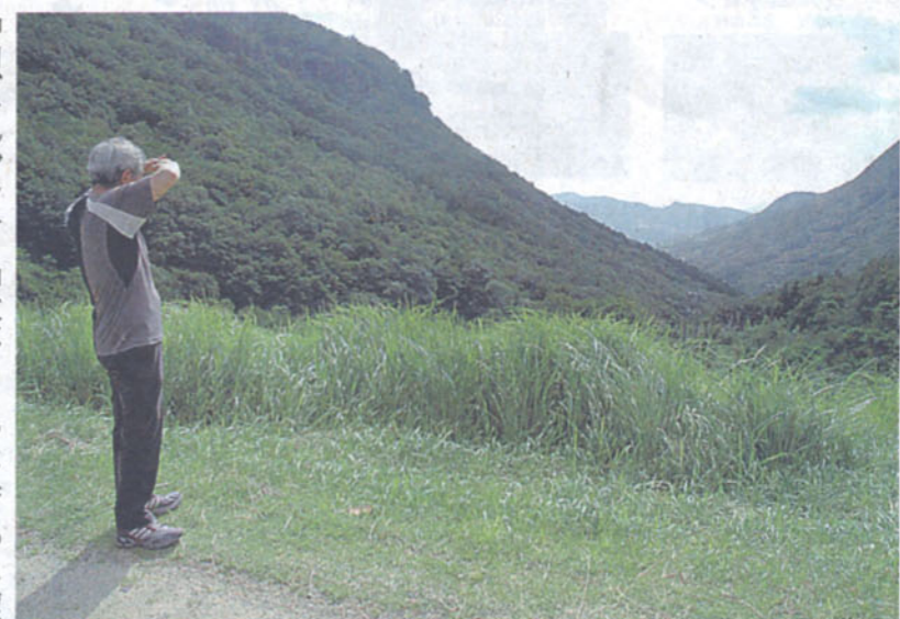
右近が潜伏したと思われる人里離れた場所から望む小豆島の山並み。どんな思いでこの景色を眺めていたのだろうか

初夏にはホテルが舞う自然豊かな中山の「ホテルの郷」をさらに上ると、細い道沿いに「高山右近潜伏の地」と彫られた石碑があった。「実際の潜伏の地かどうかは定かではないが、こ