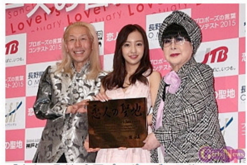
「恋人の聖地 全国プロポーズの言葉コンテスト」より

5月27日、「第9回 恋人の聖地 全国プロポーズの言葉コンテスト2015」の授賞式が青山セントグレース大聖堂で行われ、歌手の板野友美さんが「恋人の聖地親善大使」、モデルの大石参月さんが「ウェディング推進大使」の任命証を授与された。