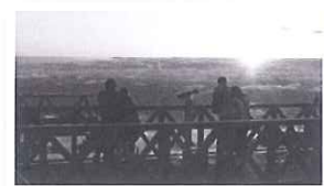
蔵王ロープウェイ山頂駅