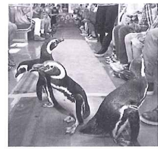
電車の中を行進するペンギンたち

これは、すみだ水族館のマゼランペンギン4羽が特別に乗車した電車に乗って東京スカイツリータウンまで行くことができるもので、お子様と保護者の方あわせて93名のお客様にご参加いただきました。車内では、お子様たちがすぐ目の前を歩くペンギンの姿に大興奮の様子で、時折ペンギンがお客様のパックのひもをつつく場面もありました。