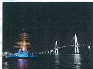
帆船海王丸と新湊大橋（夜景）

伏木富山港の海王丸パークに浮かぶ帆船海王丸は、商船学校の生徒に訓練を行う航海訓練所の大型練習帆船として、1930年（昭和5）姉妹船「帆船日本丸」とともに、神戸の川崎造船所で建造されました。地球約50周（106万海里）を航海し、延べ11,000名あまりの海の若人を育てました。また、1960年（昭和35）の日米修好通商百年祭をはじめ、カナダ建国百年祭に参加するなど、主に太平洋各地の港に寄港し、国際親善に寄与し、友好の輪を広げてきました。