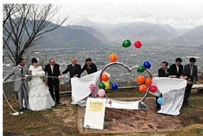
「恋人の聖地」に選定され、大町市定住促進協働会議が鷹狩山展望公園に設置した記念碑＝昨年11月2日、大町市

プロポーズにふさわしい観光スポットを「恋人の聖地」に選定しているNPO法人地域活性化支援センター（静岡市）は20日、聖地を最も地域振興に活用した団体に大町市を選び、第1回観光交流大賞を贈った。全国で209カ所の聖地を選定しているが、聖地を生かした取り組みを表彰するのは初めて。