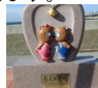
恋人の聖地 モニュメント (イメージ)