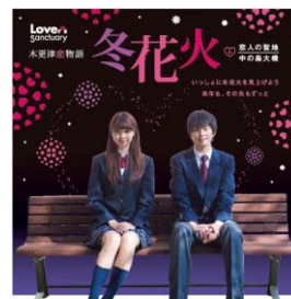
カップルチェア (イメージ)