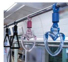
ハート型吊手 (イメージ)