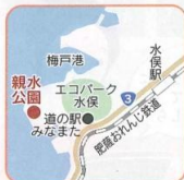
☞ 国道3号を鹿児島県出水市方面に南下した国道沿いのエコパーク水俣内

恋路島には、戦のために海を渡った若き武將と、夫の無事を祈り続けた妻の美しい恋の物語が伝えられています。この恋路島を臨む親水公園には、かわいらしいハートのモニュメントがあり、全国で約100か所認定された“恋人の聖地”として知られています。「初恋」のヒット曲で知られる故・村下孝蔵さんも水俣市出身なんだそう。