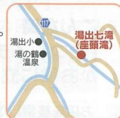
☞ 国道3号から県道117号を車で約20分

水俣の奥地には大小七つの滝が点在する湯出七滝があります。水俣市内から湯出川の上流に向かい、湯の鶴温泉の入口に七滝遊歩道へ通じる道があり、一番近くにある座頭滝には車で近くまで行くことができます。また、道は険しくなりますが、上流にある最大の大滝は全長30m幅7mで、叩きつけるように垂直に落ちる水の流れはしばしば見とれてしまう豪快さ。自然に囲まれ、癒されること間違いなし！