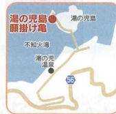
☞ 国道3号から県道56号を車で約10分

洞窟風呂や絶景を眺めることができる露天風呂など様々なお風呂が楽しめる湯の児温泉の先に浮かぶ、「湯の児島」。この島には亀のオブジェがあり、中でも一番大きい“願掛け亀”には、お賽銭が投げ込まれています。波の揺らぎや風の音のリズムに身をゆだね、願いごとを唱えましょう。