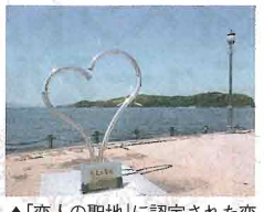
▲「恋人の聖地」に認定された恋路島を望む絶景も見逃さない

ローズフェスタ 特典 エコパーク水俣にある観光物産館まつぼっくりの「バラソフトクリーム」300円を200円に! ※巻頭のクーポンを持参ください ※有効期限は10/1(金)～11/14(日)