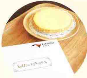
エクシスオリジナル しらはまシェフのチーズケーキ