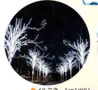
イルミネーションツリー

1月 第一回CSランキング発表 3月 中日本エクシス全エリアのハイウェイスタンプが完成 7月 全国の高速道路SA初！中央道 談合坂SA(上)で、宅配便によるワイン(酒類)の販売開始 SAPAにポケモン初登場「ポケモンSA★PA大冒険」キャンペーン開始 12月 第一回メニューコンテスト開催