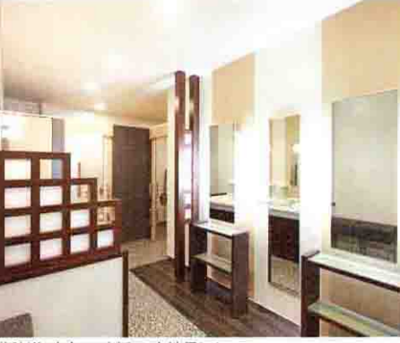
北陸道・南条SA(上)の女性用トイレ