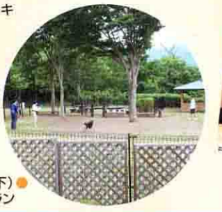
足柄SA(下) 足柄ドッグラン

4月 「エクシスオリジナル しらはまシェフのチーズケーキ」が東名高速・港北PA(下)と中井PA(上)で販売開始！ONLINE MALLにも登場 東名高速・足柄SA(上下)、東名阪・御在所SA(上下)、名神高速・多賀SA(下)を施設拡大、リニューアル予定