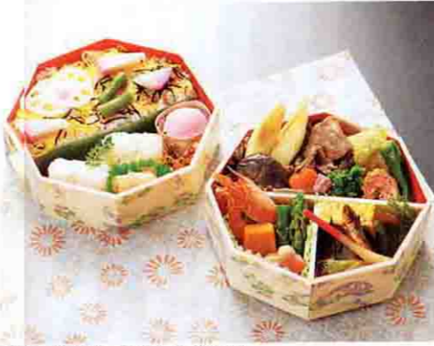
老舗調の料理を気軽に味わえる「速弁」。写真は、人形町今半(東名高速・港北PA)